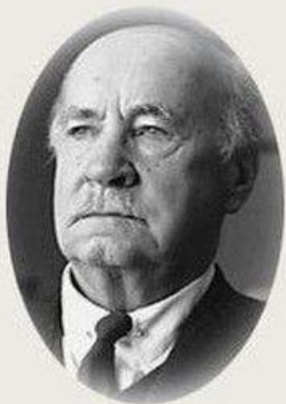
Сикорский Игорь Иванович ( 1889 - 1972 )

создал первый в мире вертолёт и бомбардировщик