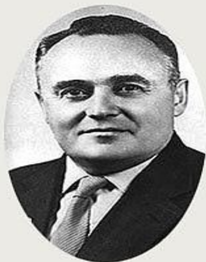
Королёв Сергей Павлович ( 1906 - 1966 )

создатель первой в мире баллистической ракеты, первого спутника Земли, космического корабля