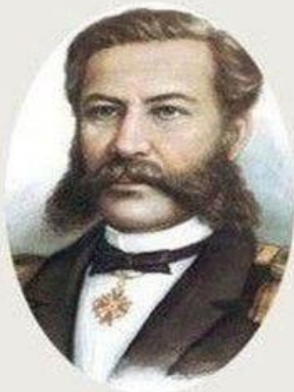
Можайский Александр Фёдорович ( 1825 - 1890 )