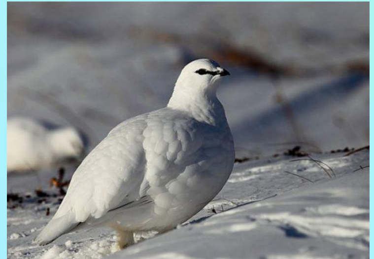
Большая белая куропатка