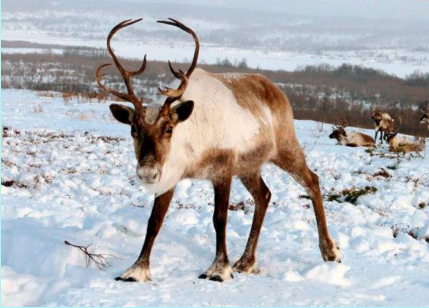
Европейский северный олень