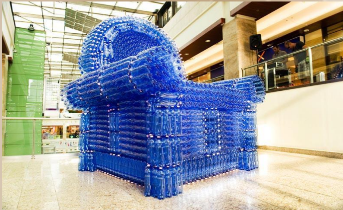
Кресло из пластиковых бутылок