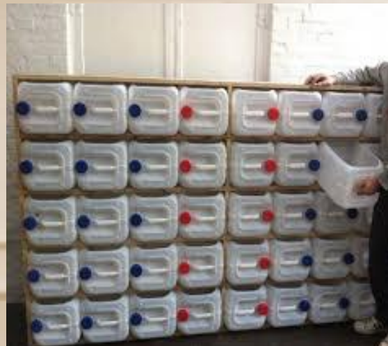
Шкаф – хранилище из пластиковых канистр