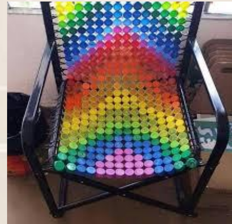
Кресло из пробок от пластиковых бутылок