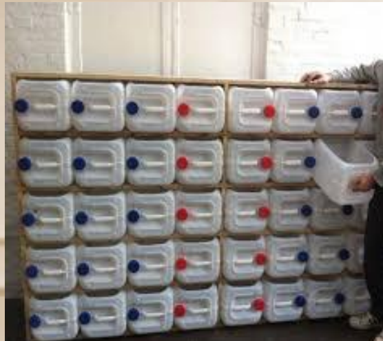
Шкаф – хранилище из пластиковых канистр