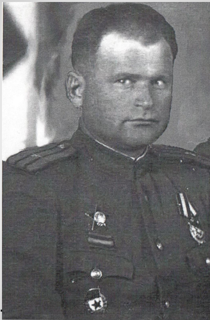
14, командир 61-го гвардейского стрелкового полка Герой Советского Союза