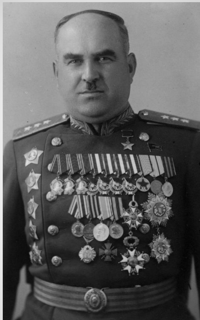
Людников Иван Ильич, генерал-полковник, командующий 39-й Армией