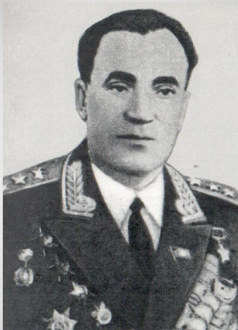
Дружинин Михаил Иванович, Герой Советского Союза, комсорг 61-го гвардейского стрелкового полка