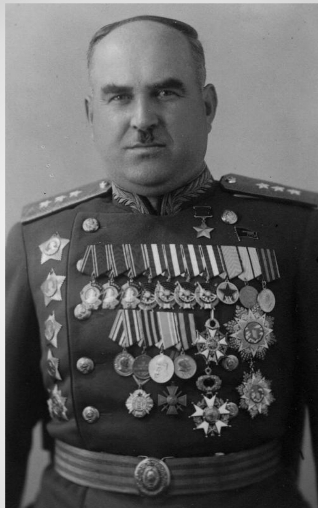
Людников Иван Ильич, генерал-полковник, командующий 39-й Армией