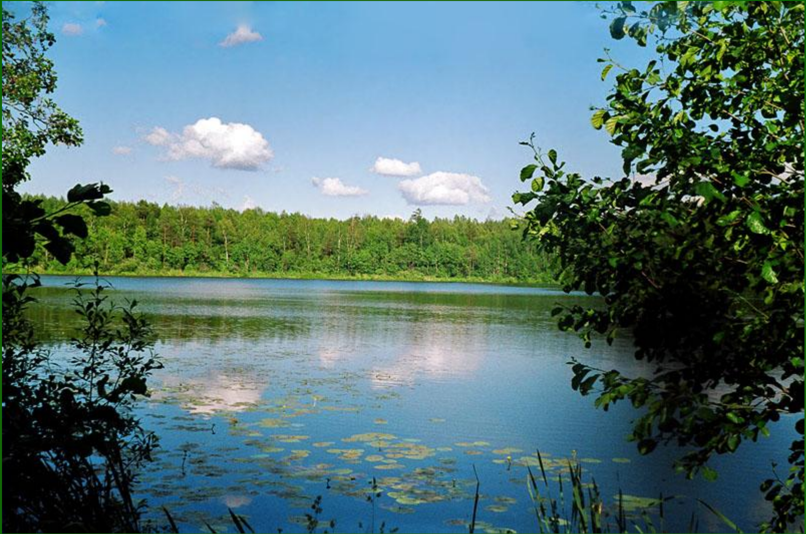
Озеро Ергеж-ер (Круглое)