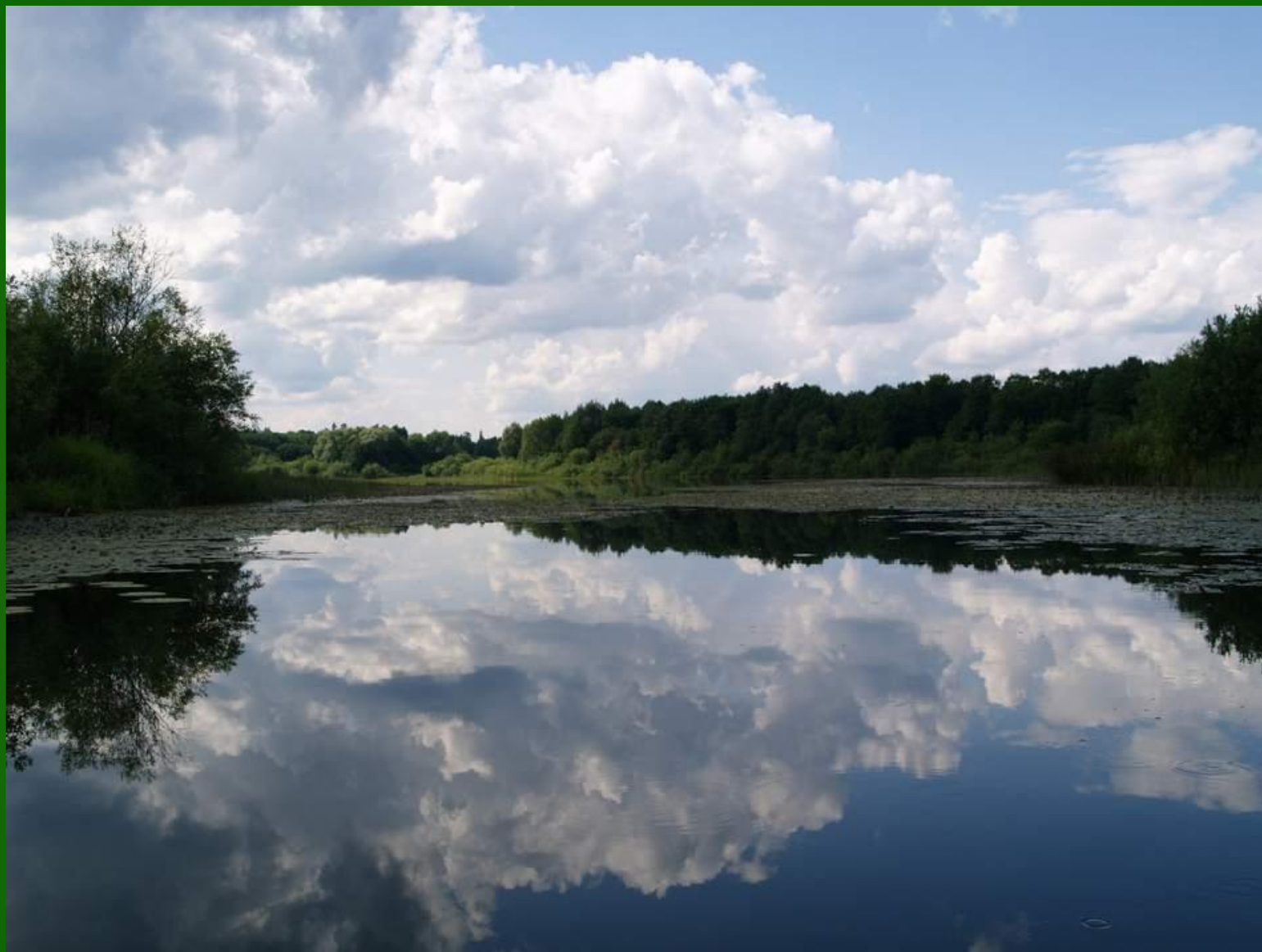
Озеро Куж-ер (Долгое)