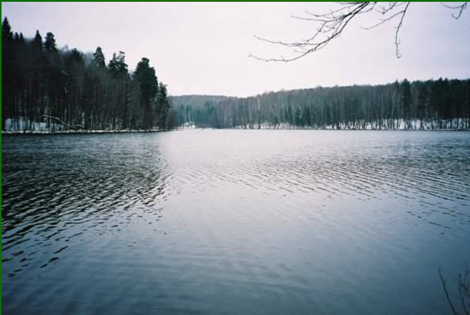
Озеро Шуть-ер (Чёрное)