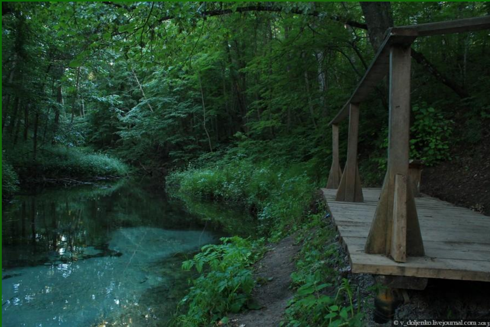
Родник «Зеленый ключ»