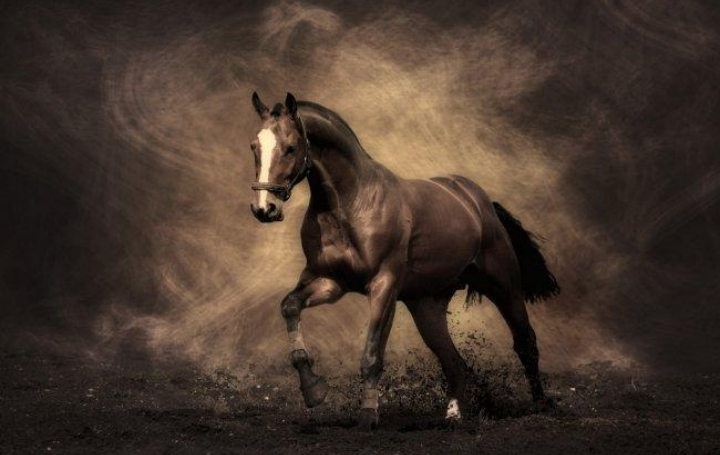
Конь - лошадь