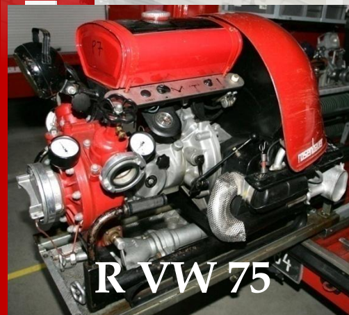
R VW 75