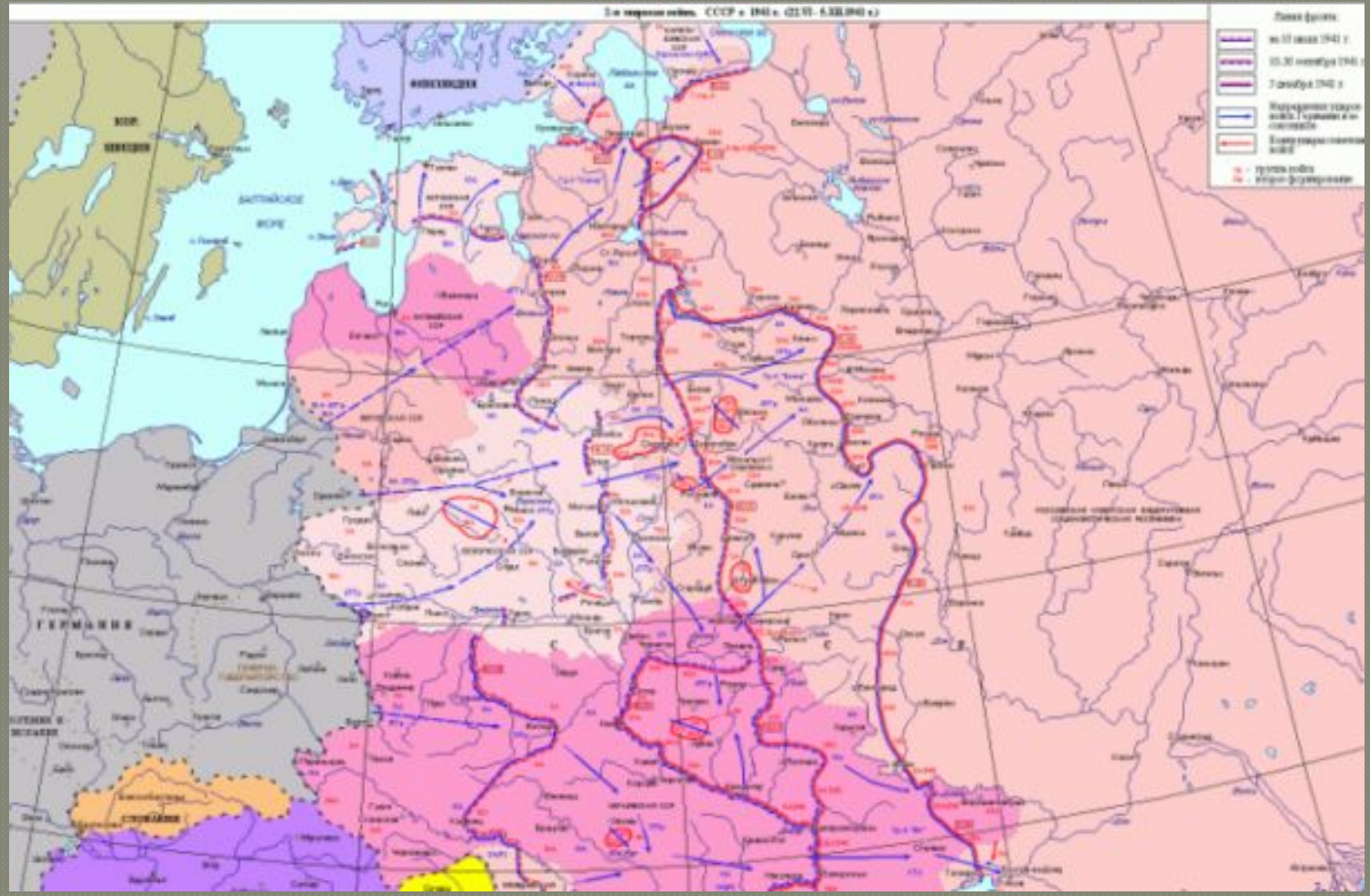
Военные операции СССР в 1941 г. (21.06-30.09.41 г.)