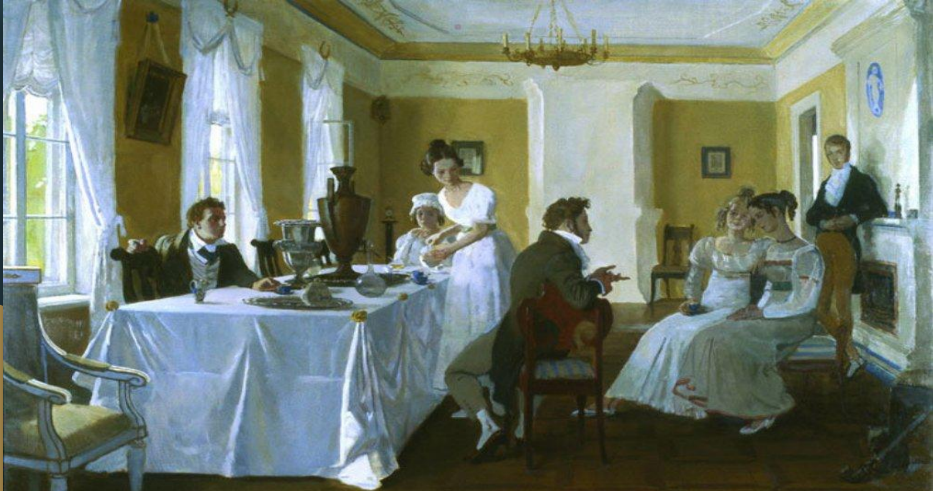
Иллюстрация к «Евгению Онегину». На столе — самовар в стиле ампир, точно переданный стиль эпохи, когда самовары были в домах очень богатых людей — начало 19 века.