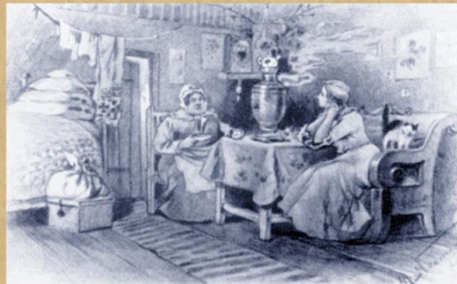
«Капитанская дочка». Художник М.Нестеров.