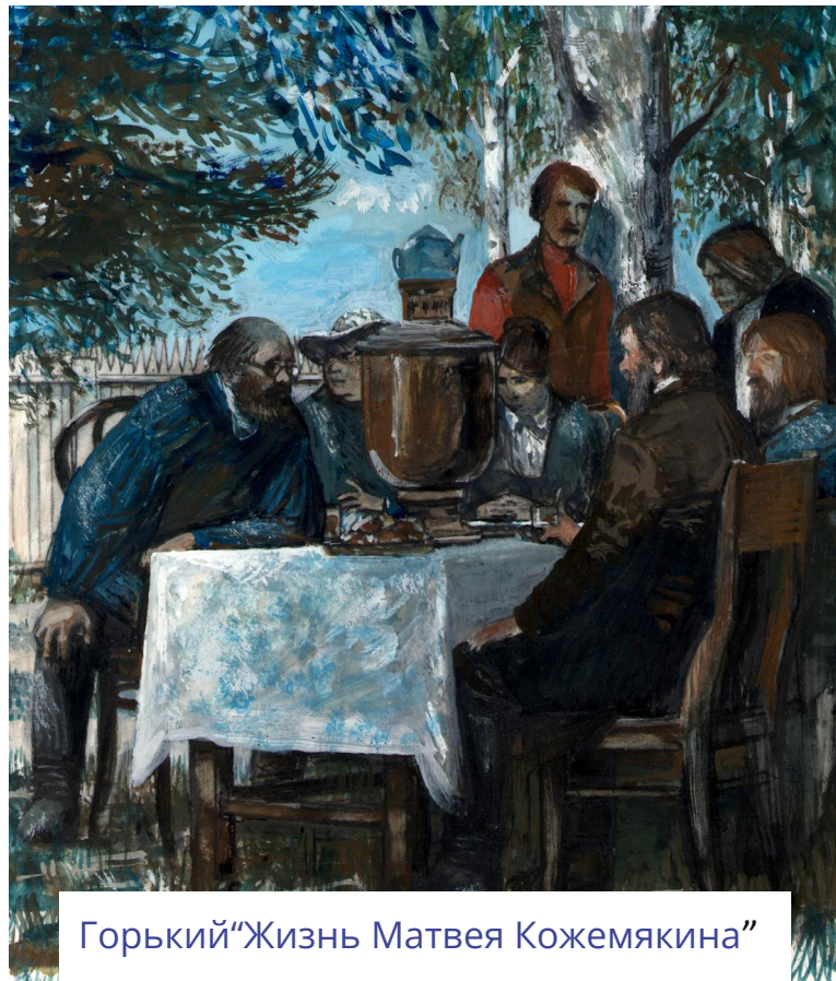
Горький «Жизнь Матвея Кожемякина»

В праздничные вечера в домах и в палисадниках шипели самовары, и, тесно окружая столы, нарядно одетые семьи солидных людей пили чай со свежим вареньем, с молодым мёдом. Весело побрякивали оловянные ложки, пели птицы на косяках окон, шумел неторопливый говор, плавал запах горящих углей, жирных пирогов, помады, лампадного масла и дёгтя, а в сетях бузины и акации мелькали, любопытно поглядывая на улицу, бойкие глаза девиц.