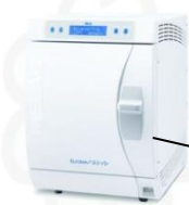
Автоклав с камерой на 22 л. с однократным предварительным вакуумом