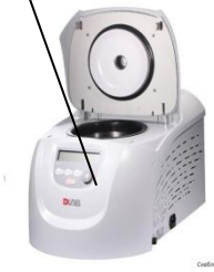
Высокоскоростная рефрижераторная центрифуга D 3024R