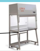
Ламинарное укрытие (бокс) БАВнп-01-«Ламинар-С» - 1,2