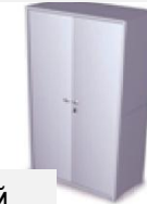
Шкаф лабораторный дезинфекционный для хранения посуды и материалов