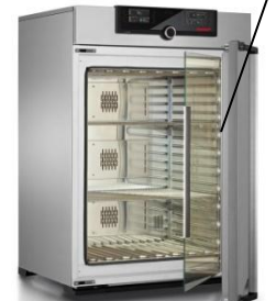
Камера постоянных климатических условий тепло-холод-влаги Memmert HPP 110