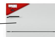
CO2-инкубатор Binder CB 150