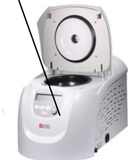
Высокоскоростная рефрижераторная центрифуга D 3024R