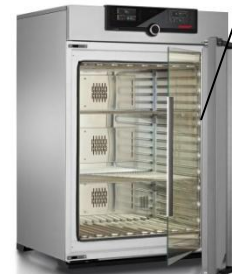
Камера постоянных климатических условий тепло-холод-влаги Memmert HPP 110