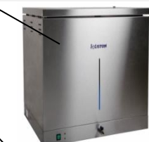
Аквадистиллятор лабораторный автоматический со встроенным сборником