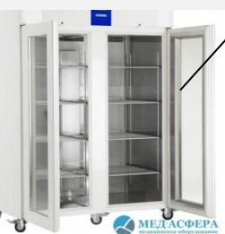
Холодильник Liebherr LKPv 1423 Mediline с контроллером PROF