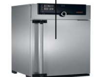
Шкаф сушильный Memmert HPP UN55 с естественной конвекцией