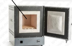
Муфельная печь SNOL 30/1100 LSF 01