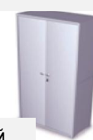
Шкаф лабораторный дезинфекционный для хранения посуды и материалов