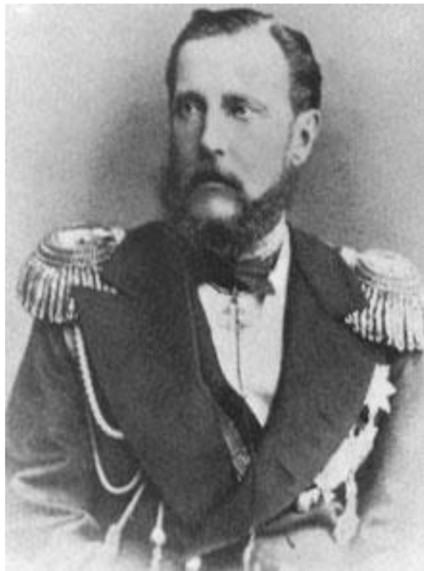
Великий князь Константин Николаевич

Великий князь был личностью неординарной и благодаря его деятельному влиянию, комитет начал разработку мер. В частности, были созданы губернские комитеты.