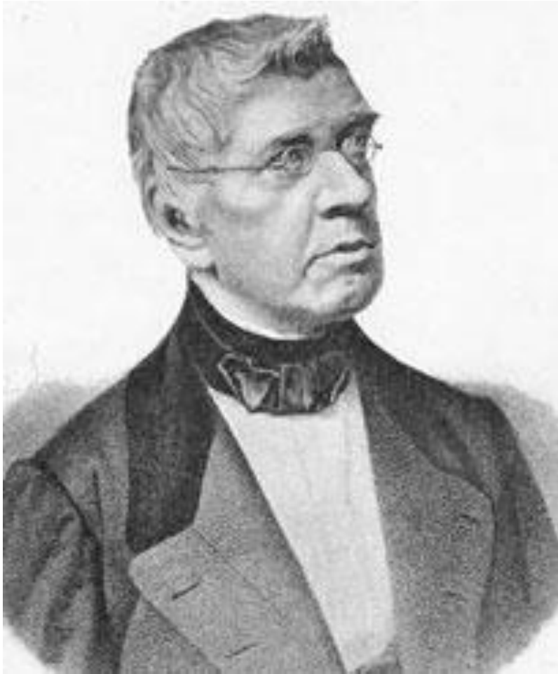
Граф В. Н. Панин

Со смертью Ростовцева на его место был назначен граф Панин, что многими было воспринято, как свертывание деятельности по освобождению крестьян.