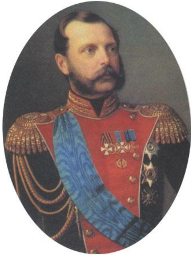
Александр II (1855 -1881)

Александр II создает Секретный комитет «для обсуждения мер по устройству быта помещичьих крестьян» под его личным председательством.