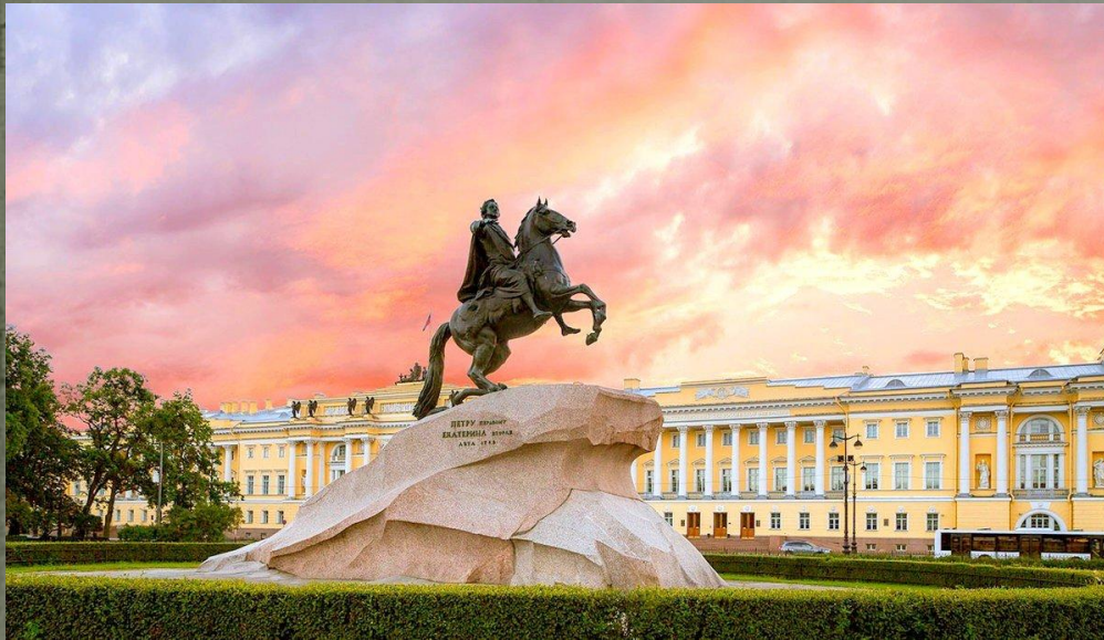
Памятник «Медный всадник» Санкт-Петербург