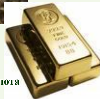
Слитки золота и серебра