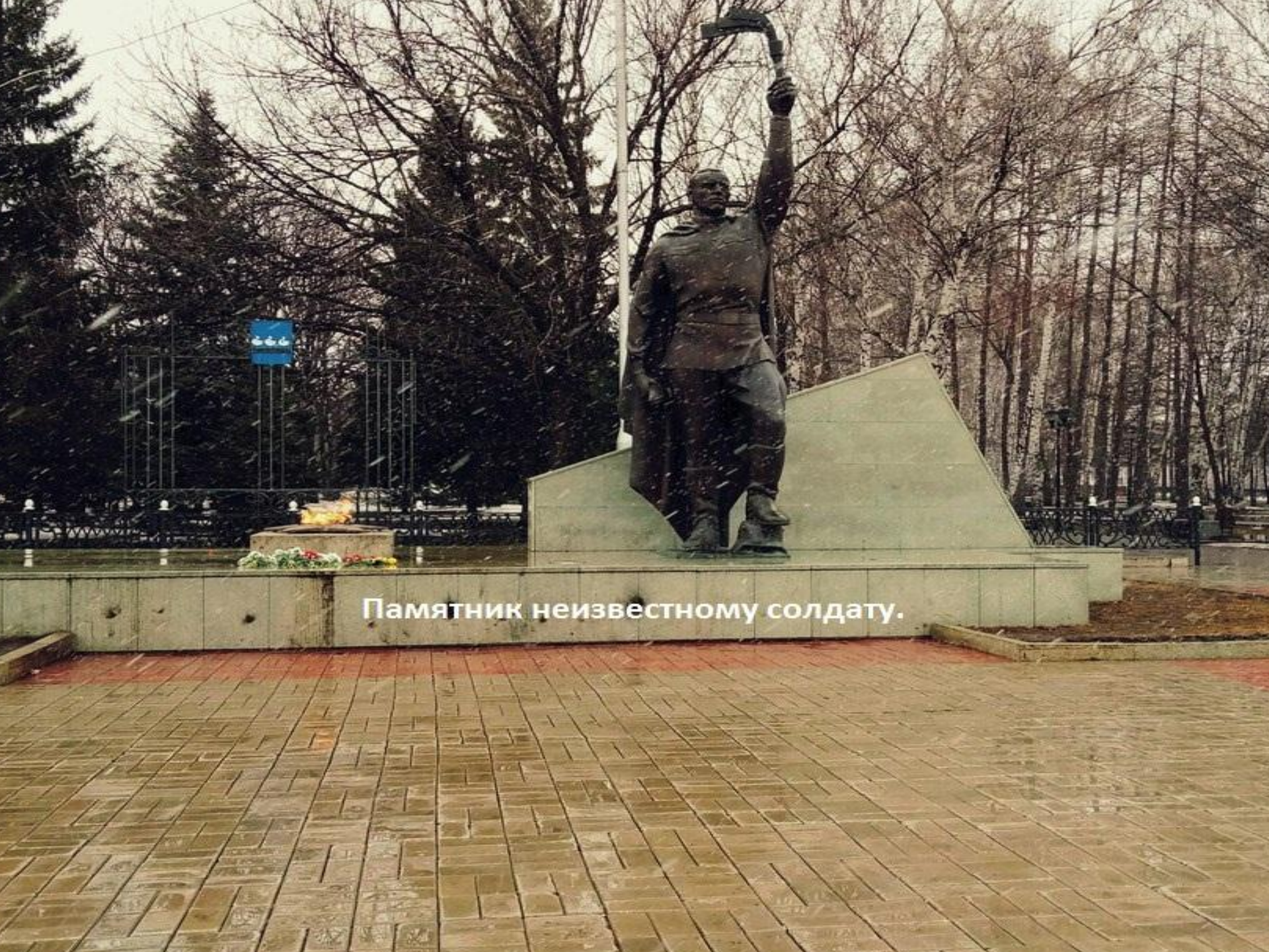
Памятник неизвестному солдату.