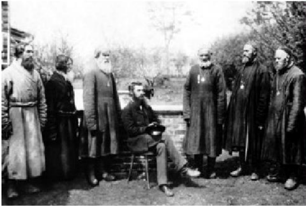
Волостные старшины у земского начальника. Нижегородская губерния, 1891 г.

В 1889 г. принято «Положение о земских участковых начальниках».