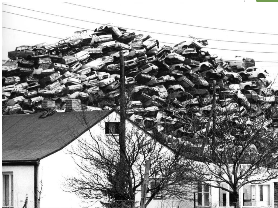
Гора старых автомобилей возвышается за домом в Берлине, фото 1973 года