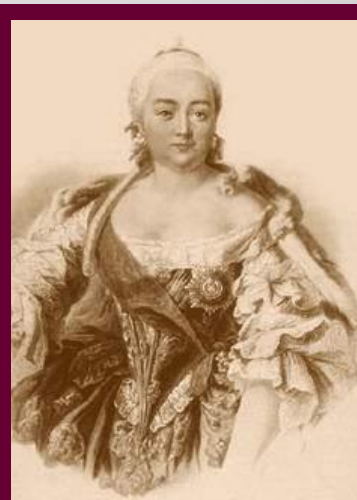
Анна и Елизавета Дочери Петра I