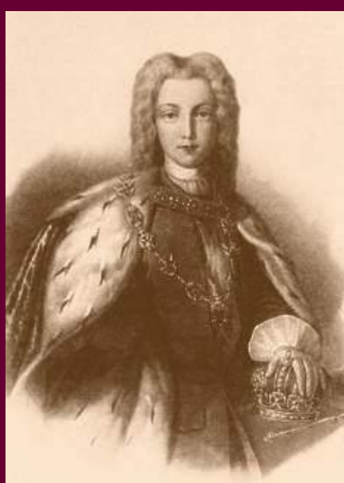
Петр (сын царевича Алексея)