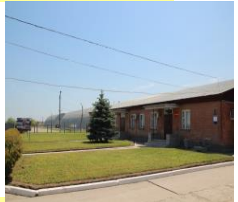
ОЧИСТКА ВНУТРЕННЕЙ ТЕРРИТОРИИ