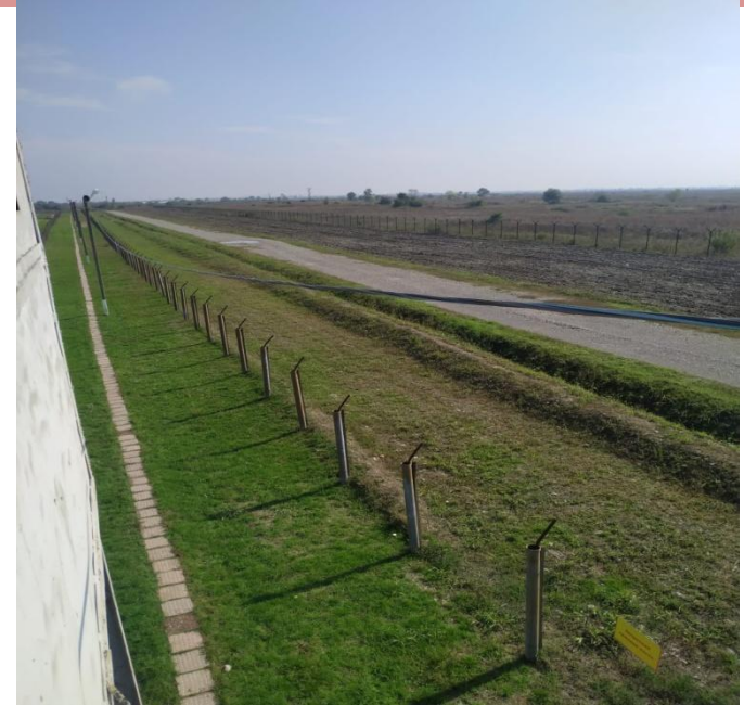
ОПАШКА ВНЕШНЕГО ПЕРИМЕТРА