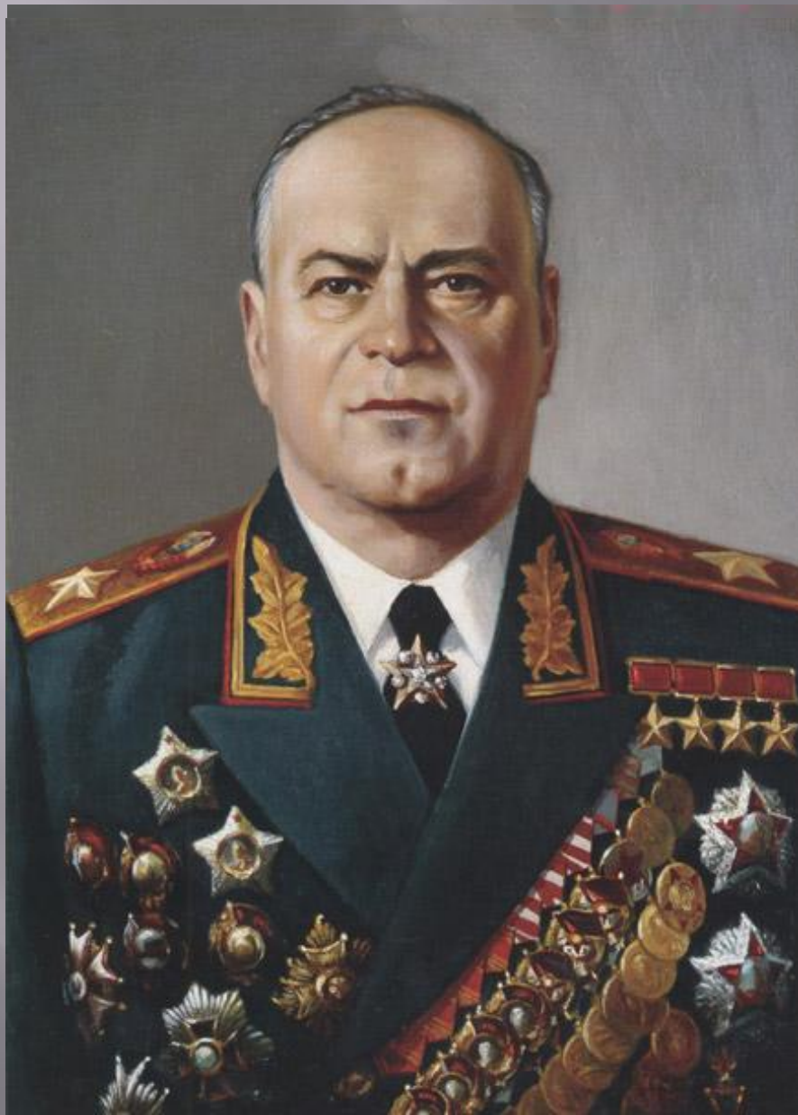
Маршал Г. К. Жуков