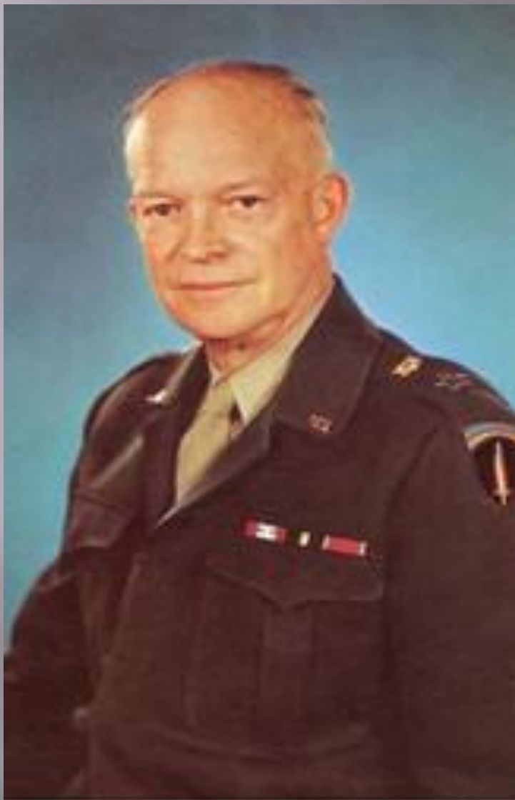
Генерал Дуайт Эйзенхауэр