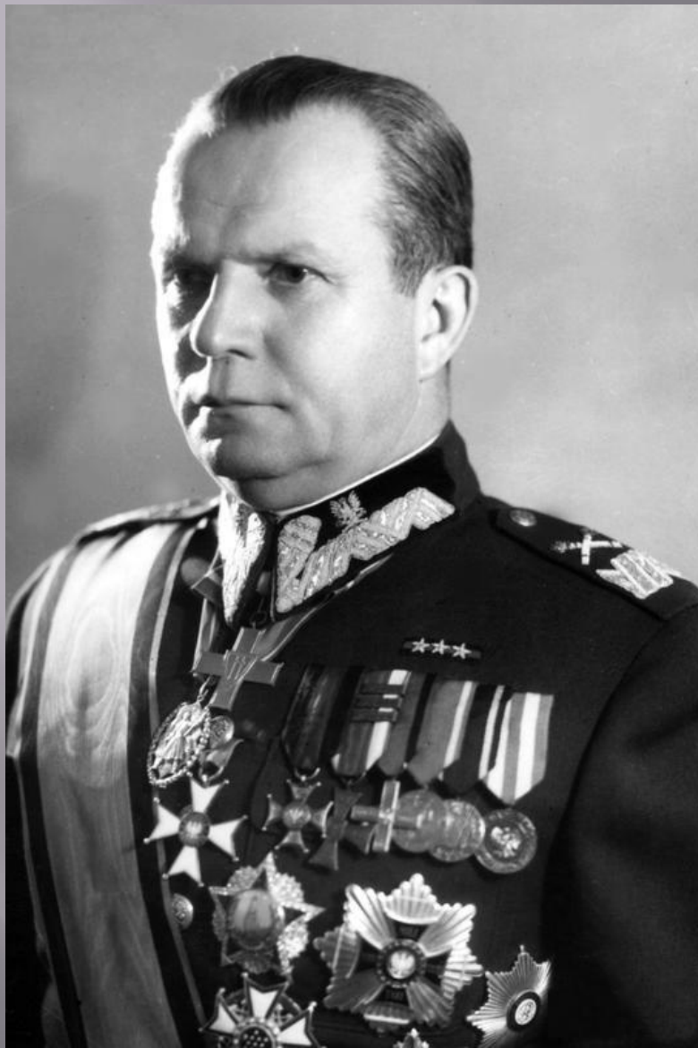
Маршал Михал Роля-Жимерский