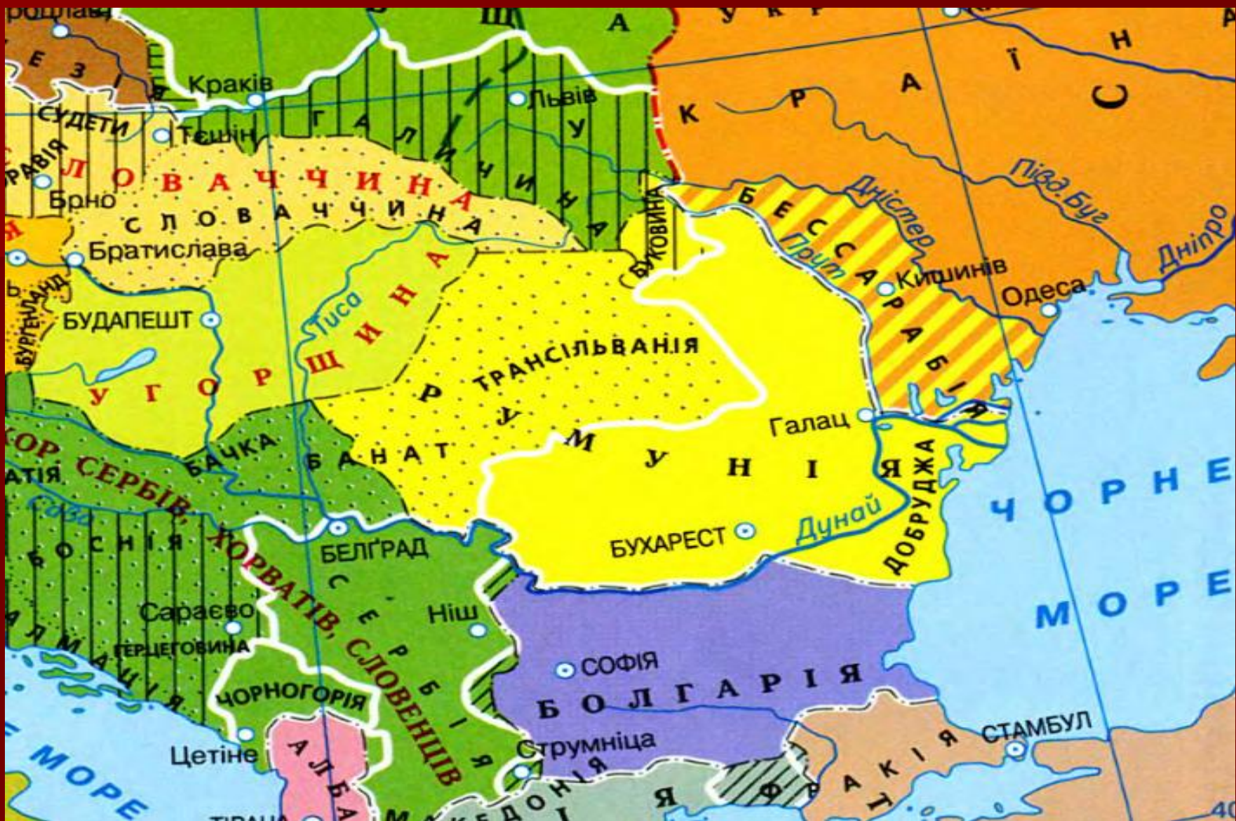
Карта Румунії в 1921-1939 рр.