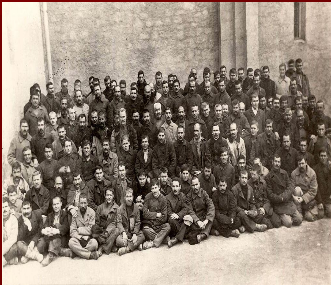
Засуджені до каторжних робіт татарбунарські повстанці

Розправившись з повсталими і заарештувавши багатьох його учасників, румунська влада в 1925 році інсценували «процес 500», який повинен був довести, що Татарбунарське повстання — «справа рук Москви». 85 осіб було засуджено на різні терміни ув'язнення.