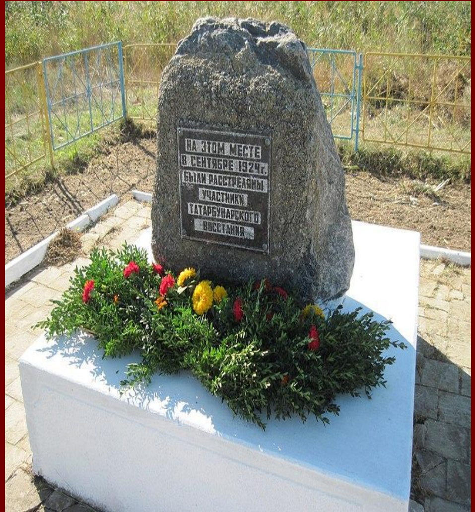
Місце розстрілу повстанців на околиці Татарбунар