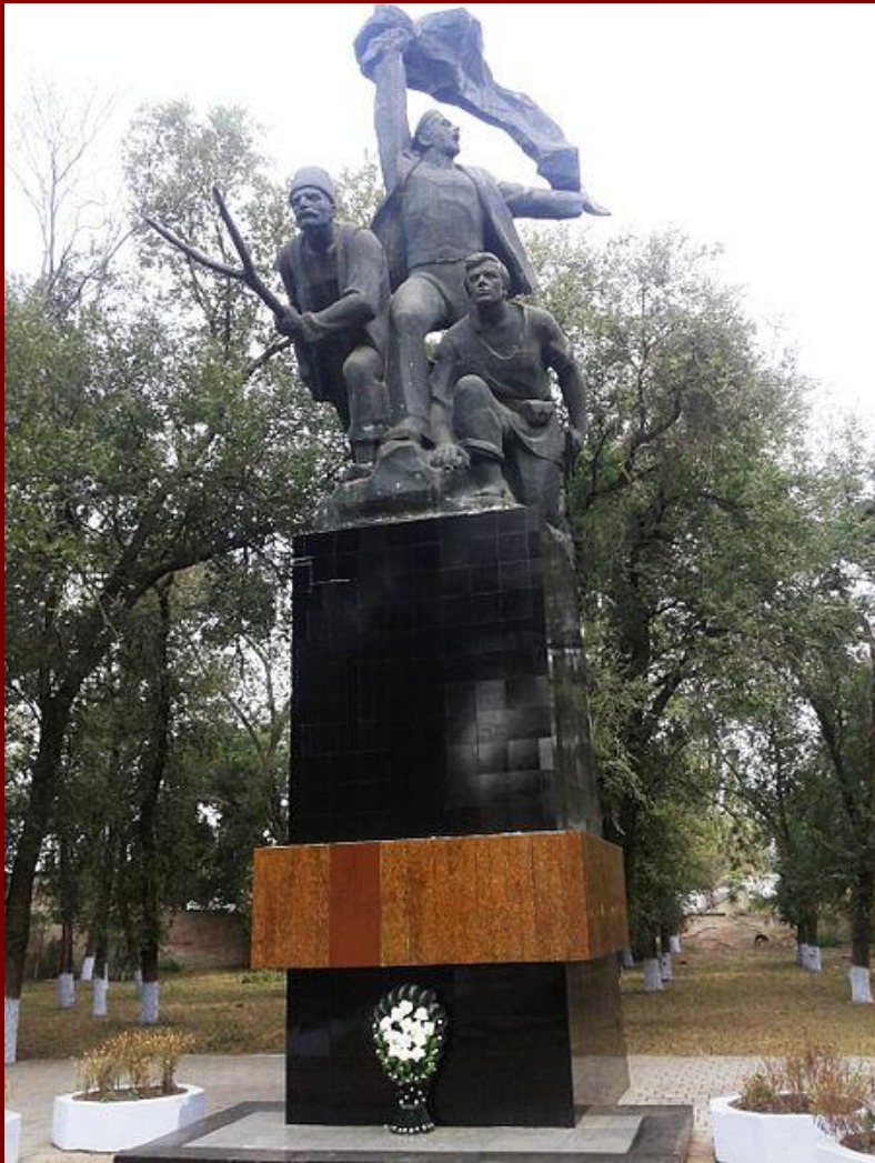
Монумент повстанцям у татарбунарах