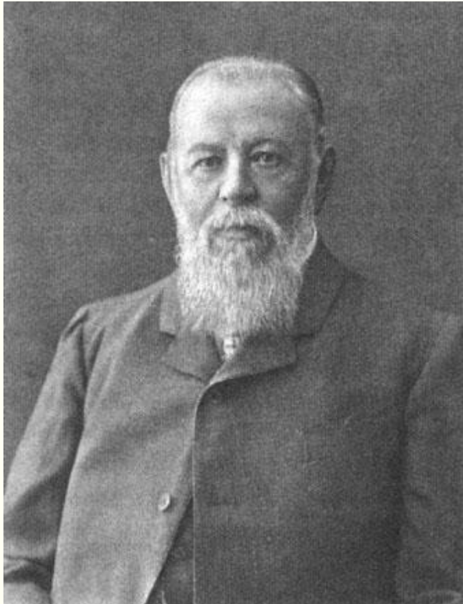
Николай Федорович Анненский