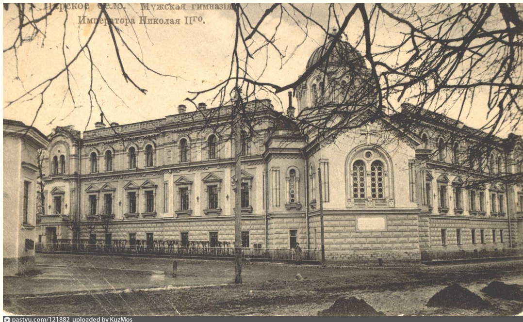
Мужская гимназия Императора Николая II