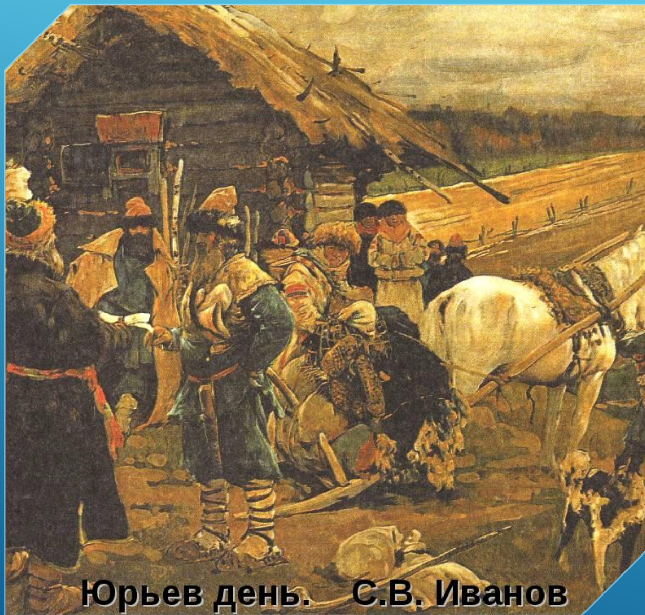
Юрьев день. С.В. Иванов