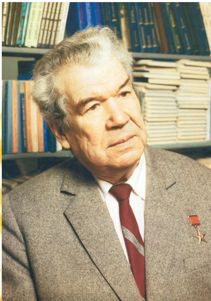
Мостай Кәрим (1919 -2005)