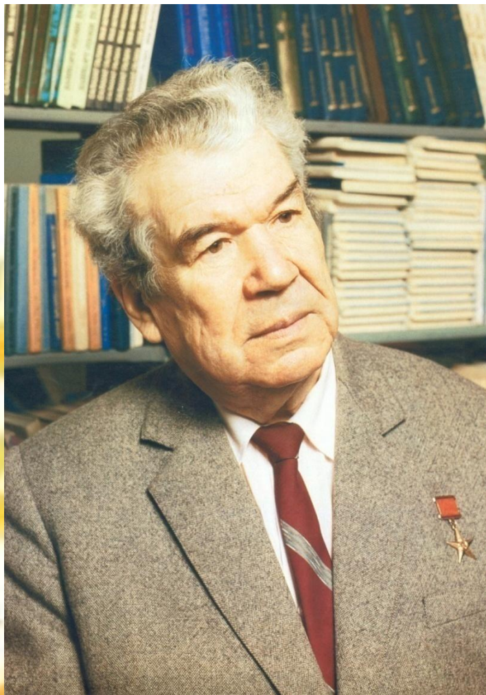
Мостай Кәрим (1919 -2005)