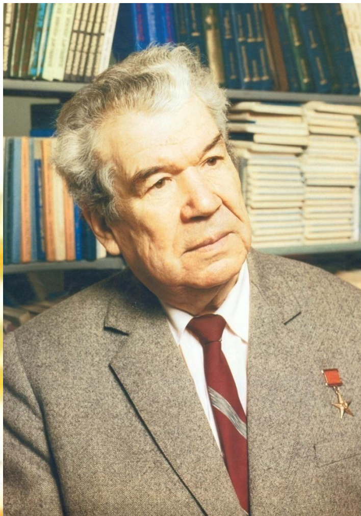
Мостай Кәрим (1919 -2005)