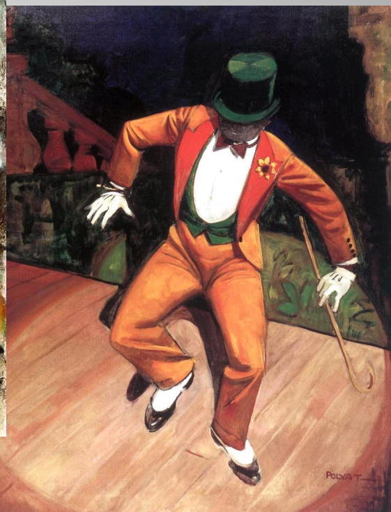
Поля Тибор. Танцор