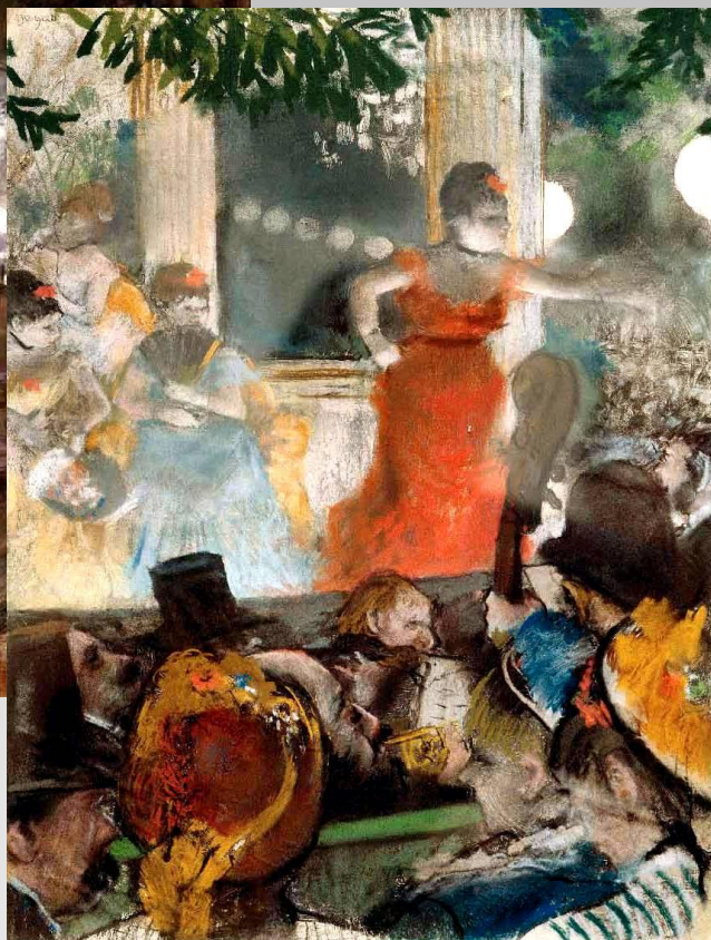
Эдгар Дега. Кафешантан Лез Амбассадор