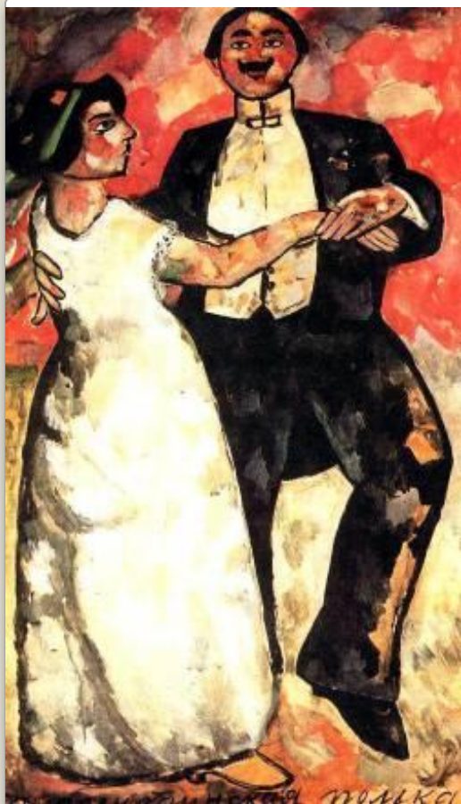
К.Малевич. Аргентинская полька