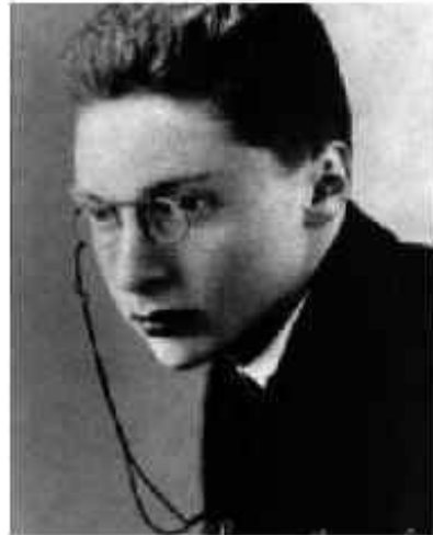
Роман Осипович Якобсон (1896–1982)