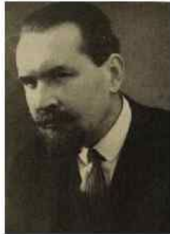
Николай Сергеевич Трубецкой (1890–1938)