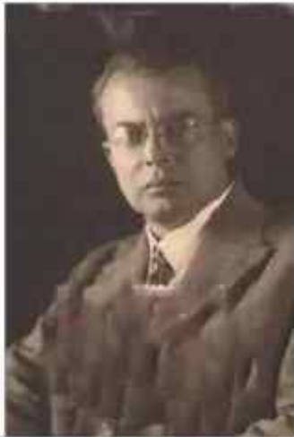
Вилем Матезиус (1882–1945)