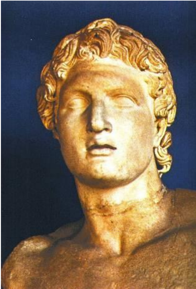
Александр Македонский (356-323г.г.до н.э.)

В 334г.до н.э. греко-македонское войско переправилось через пролив, отделяющий Европу от Азии.