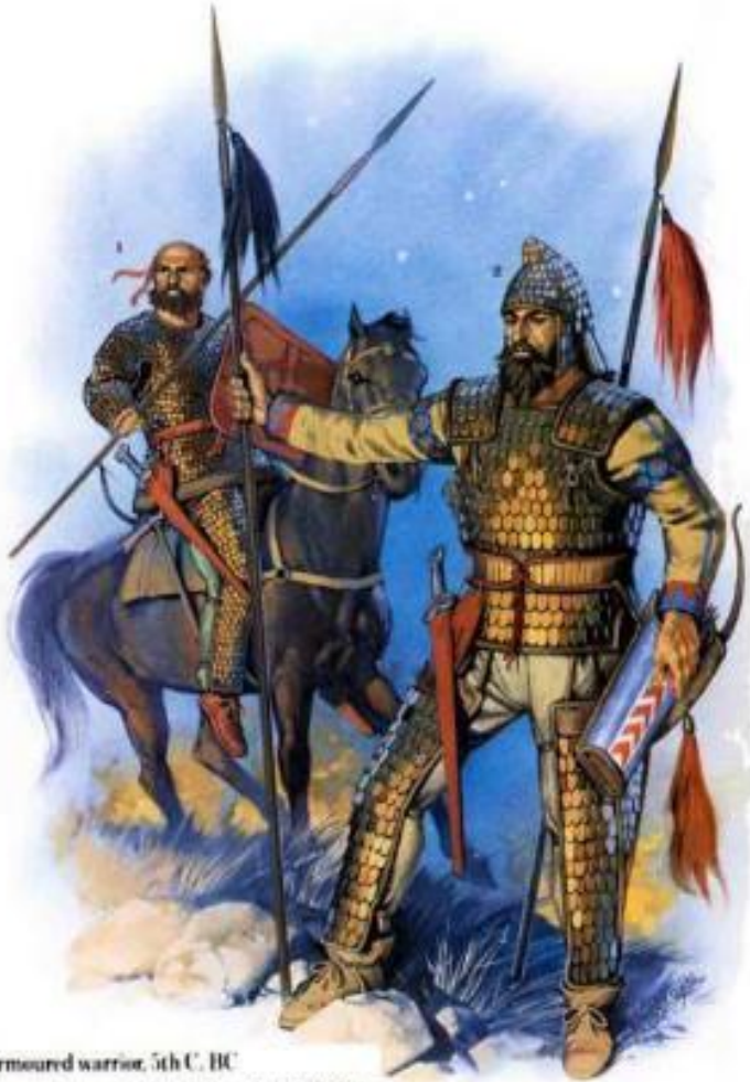
1. Armoured warrior, 5th C. BC