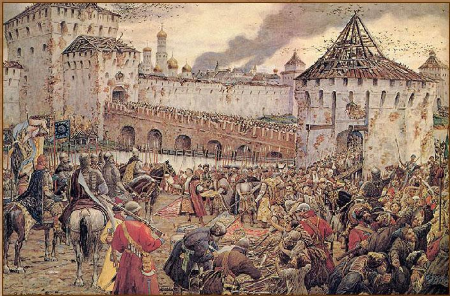
Изгнание польских интервентов из Московского Кремля в 1612 г.