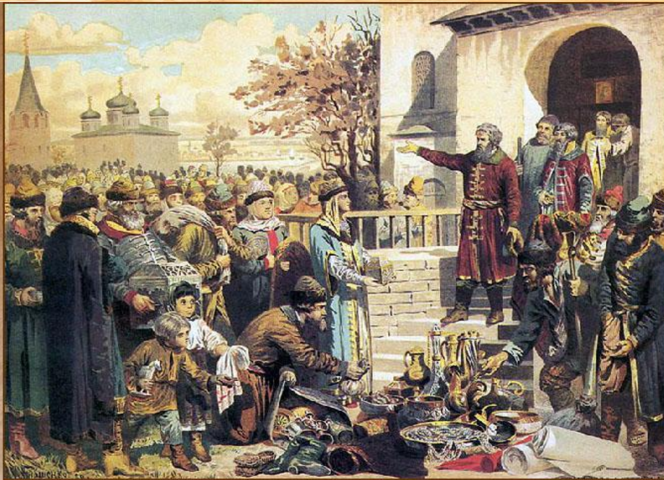
Воззвание Козьмы Минина к нижегородцам

Осенью 1611 г. по призыву нижегородского купеческого старосты К. Минина началось формирование народного ополчения.