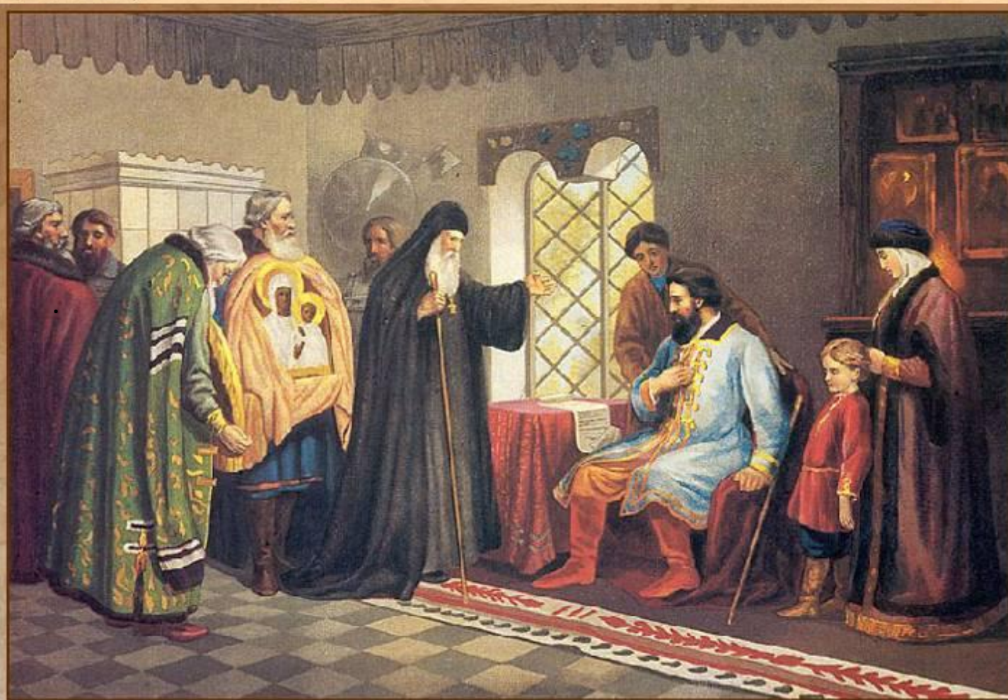
Нижегородские послы у князя Дмитрия Пожарского. 1611 г.

Военным руководителем ополчения стал князь Д. М. Пожарский.