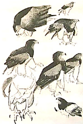
В. Ватагин. ОРЛАН