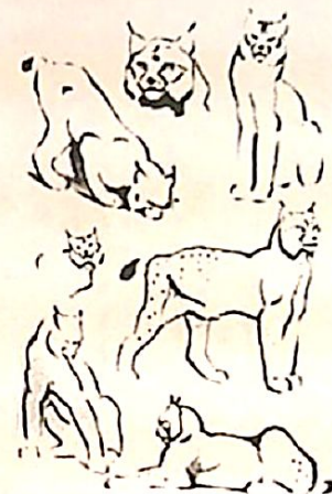
В. Ватагин. РЫСЬ