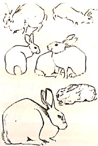
В. Ватагин. ЗАЯЦ

Посмотри внимательно на быстрые рисунки графика Василия Ватагина и юных художников