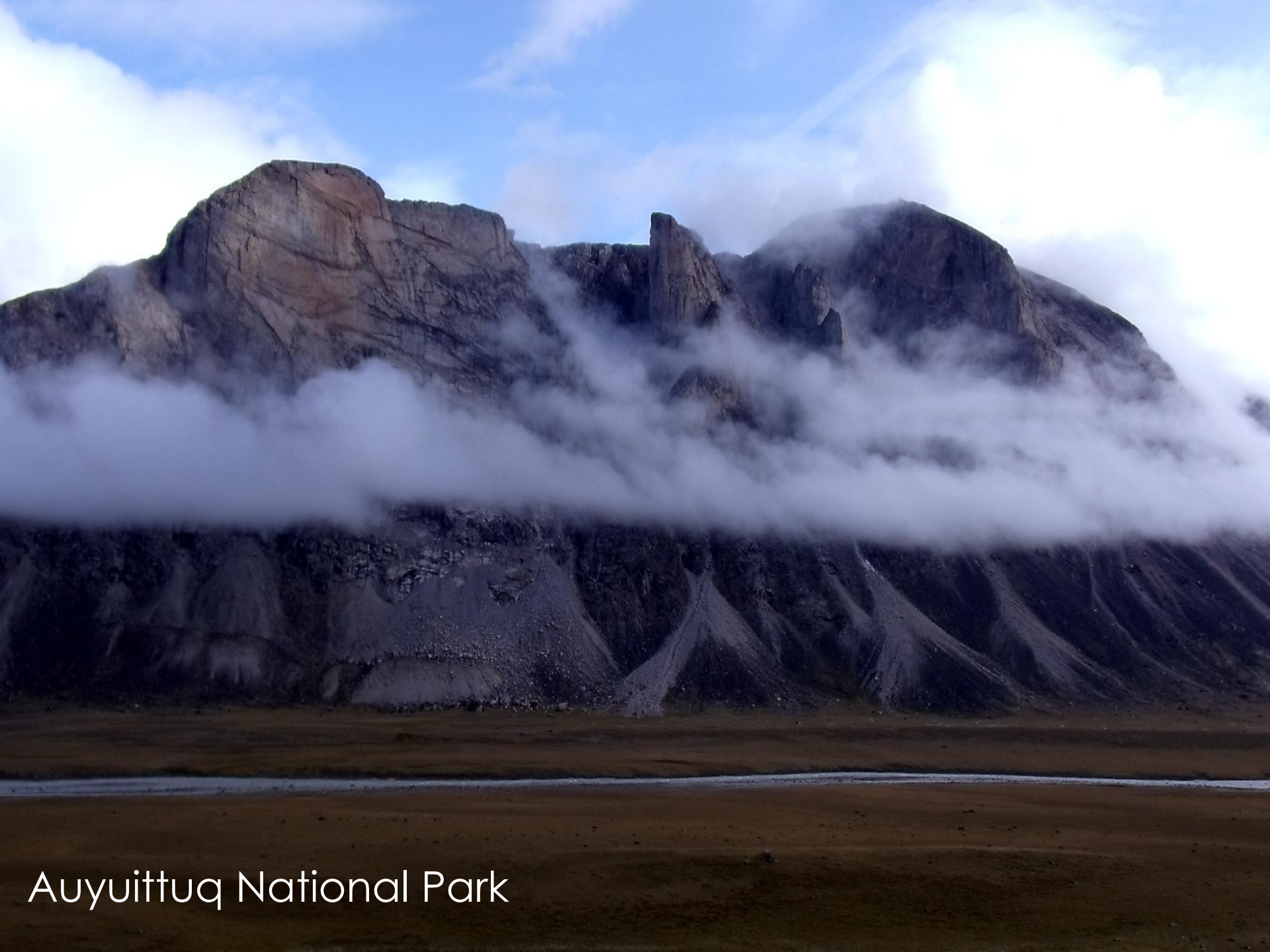
Auyuittuq National Park