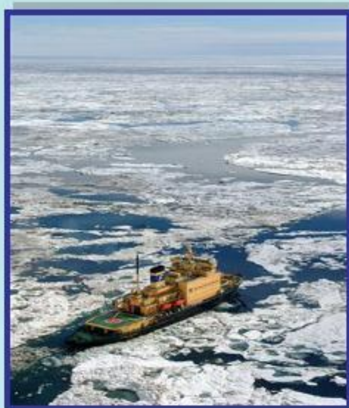
Северный морской путь