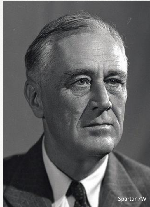
Франклин Рузвельт 1882–1945 гг.

Было запрещено применять детский труд, введены максимальная продолжительность рабочей недели и минимум заработной платы.