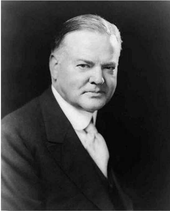
Герберт Гувер 1874–1964 гг.

В США избранный в 1928 г. президент Г. Гувер не видел необходимости принимать эффективные меры для борьбы с экономическим кризисом.