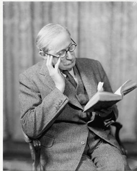
Леон Блюм 1872–1950 гг.

В 1936 г. сформировано правительство, которое возглавил Леон Блюм.