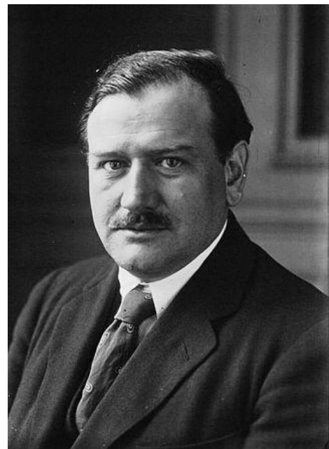
Эдуард Даладье 1884–1970 гг.

Новое правительство возглавил радикал Эдуард Даладье, осуществление политики Народного фронта было прекращено.