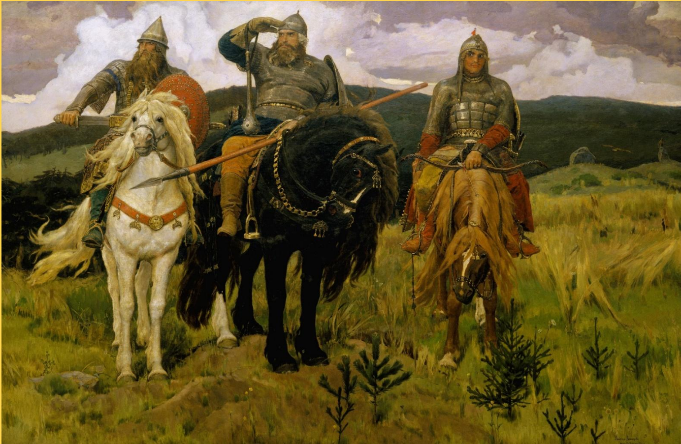
В. М. Васнецов «Богатыри»