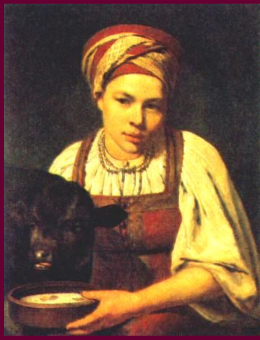
А.Венецианов.Крестьянская девушка с телянком.

Население России к к.18 в.до- стигло 37 млн.человек.51% населения составляли не- русские народы.В ряде слу- чаев они имели большие права,чем русский народ (На Украине до 1783 г.не было крепостничества.)