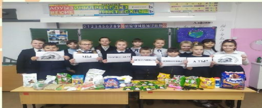
Акция "Добролап" Помощь приютам с бездомными животными