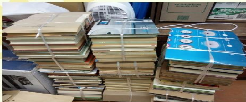
Акция: "Помоги библиотеке"

Задачи: формировать нравственные ценности; воспитывать гражданско-патриотические чувства детей