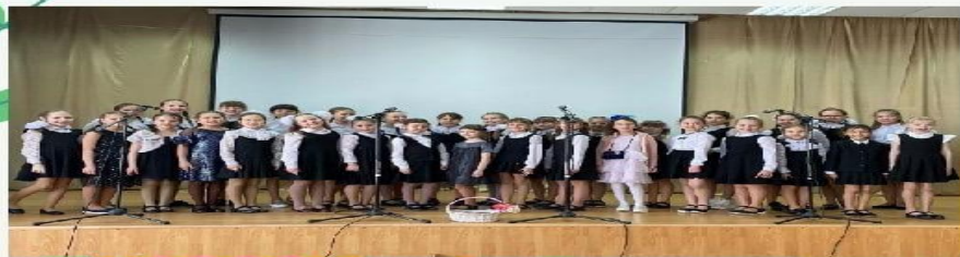
Выступление школьного хора на 8 марта