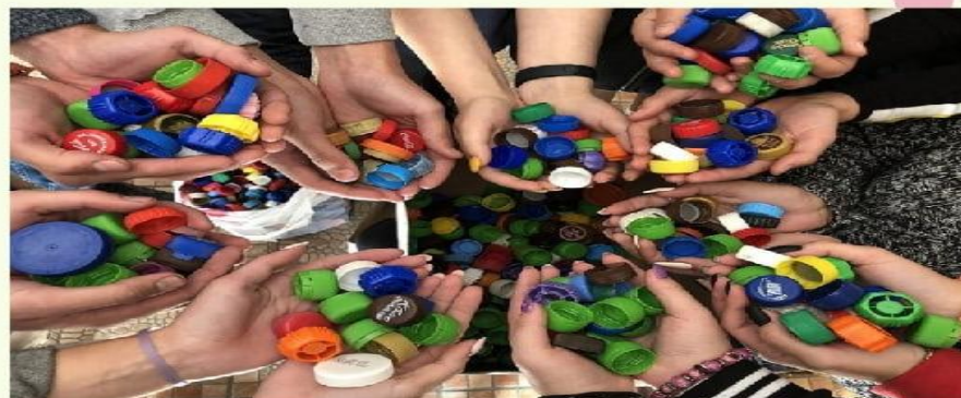
Акция "Добрые крышечки" Сбор крышечек для помощи больным детям