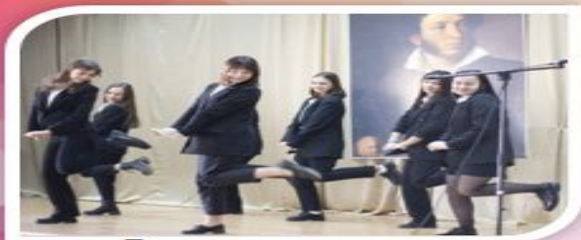
Танец на день учителя под девизом: «Танцуй ради жизни»