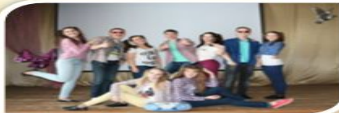
Флешмоб «Мы за здоровую Россию!»