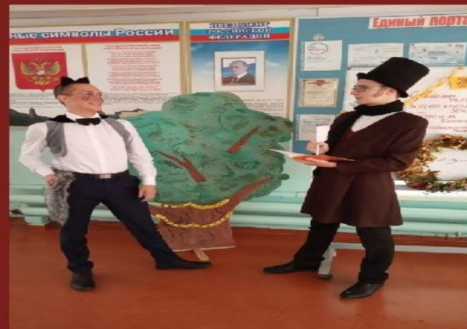
День самоуправления в Пушкинской школе