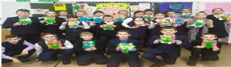
Открытка для мамы

Задачи: формировать у учащихся чувства уважения и любви к женщине – матери