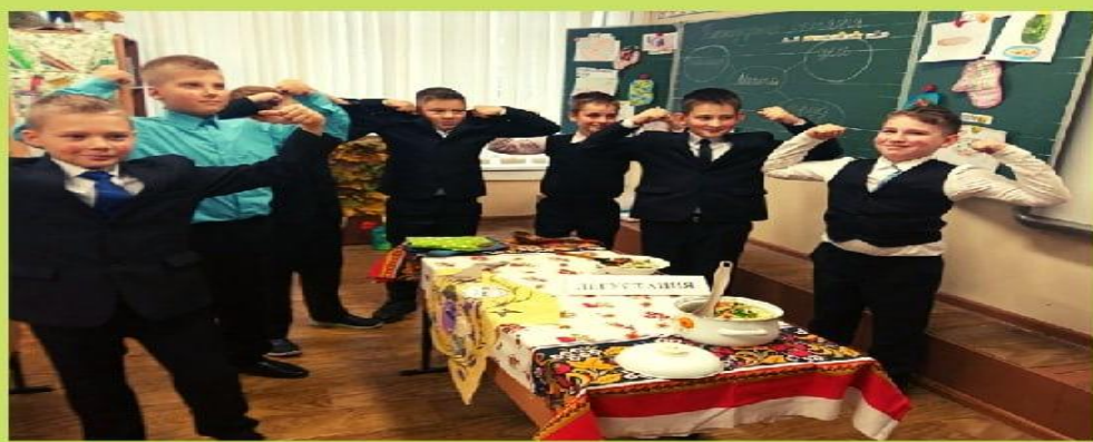
Разговор о правильном питании