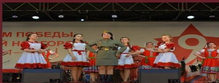
Фестиваль военных танцев