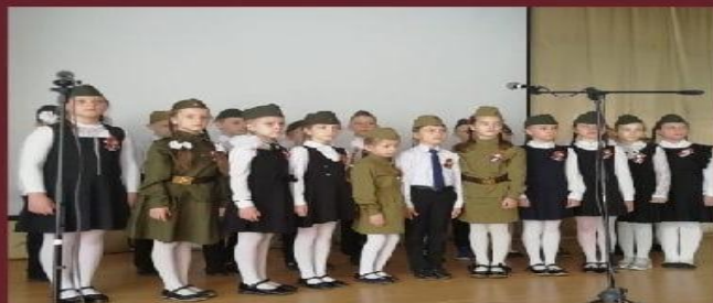
Песни военных лет

ЗАДАЧИ: СФОРМИРОВАТЬ ПРЕДСТАВЛЕНИЕ О ПОДВИГАХ ДЕТЕЙ В ГОДЫ ВОВ