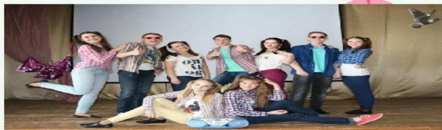
Фестиваль девчачьих танцев