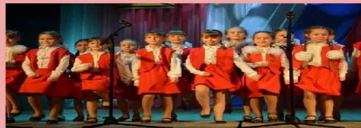
Фото с мероприятий в рамках Международного дня семьи