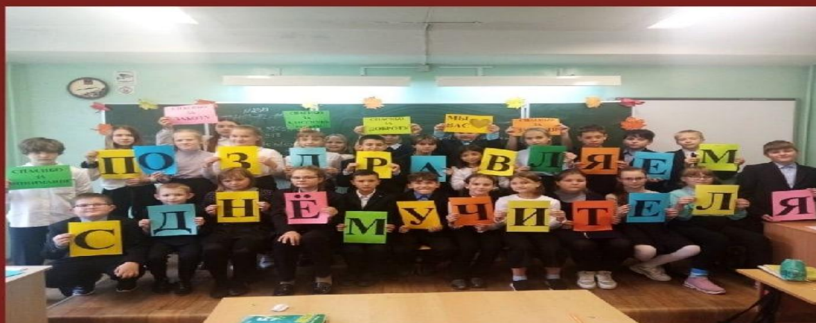
Акция "Поздравь учителя"