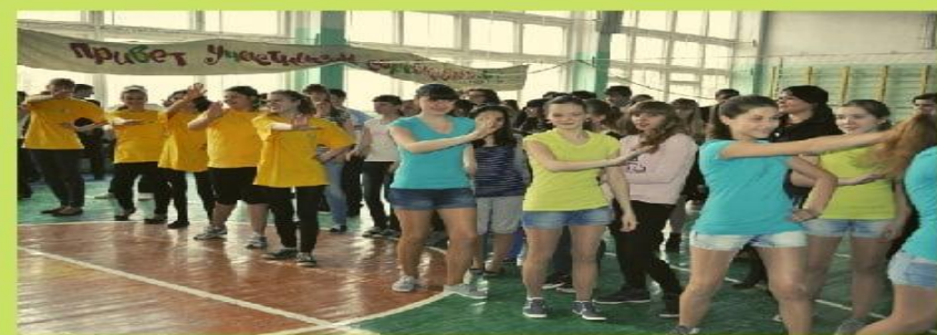
"Танцуй ради жизни"