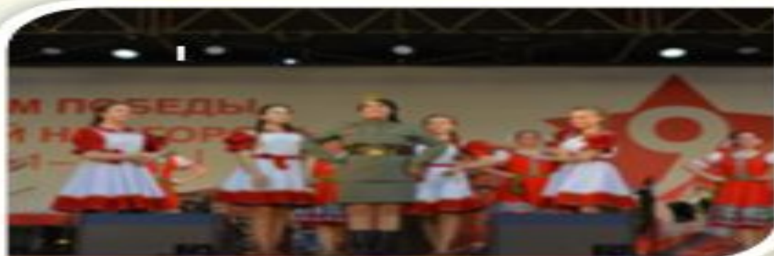
Фестиваль военных танцев