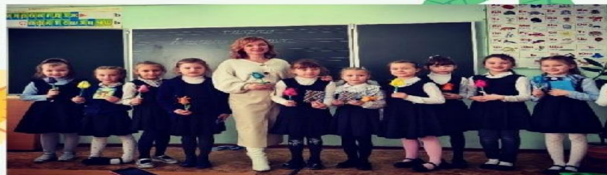
Внеклассное мероприятие "Сегодня мамин день"