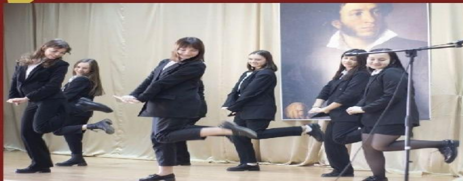
Танец на День учителя под девизом: "Танцуй ради жизни"

ЗАДАЧИ: СФОРМИРОВАТЬ КОММУНИКАТИВНЫЕ УМЕНИЯ, УМЕНИЕ ПУБЛИЧНОГО ВЫСТУПЛЕНИЯ И МУЗЫКАЛЬНОГО СЛУХА