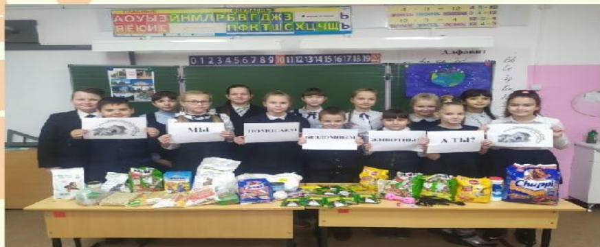
Акция "Добролап" Помощь приютам с бездомными животными