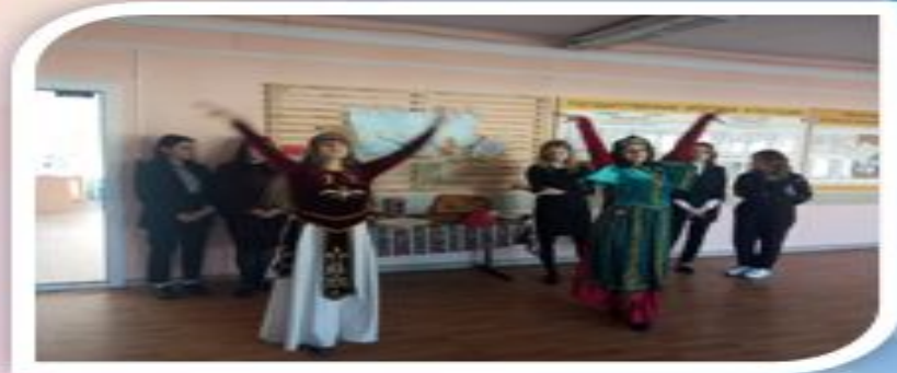
Фестиваль народов Мира