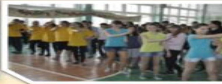
Акция «В спортивном теле - здоровый дух»