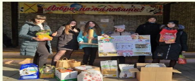
Помощь приюту "Дом с хвостом"