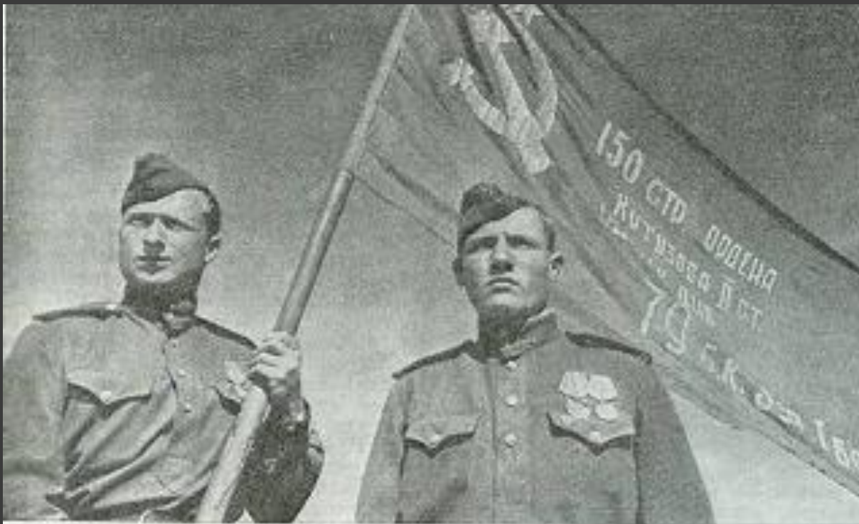
Разведчики 736-го полка 150-й стрелковой дивизии: М. А. Егоров (справа) и М. В. Кантария со Знаменем Победы, Берлин, Май 1945,

Мелитон Кантария (слева) и Михаил Егоров на фотографии 1945 года со Знаменем Победы (Алексей Берест)