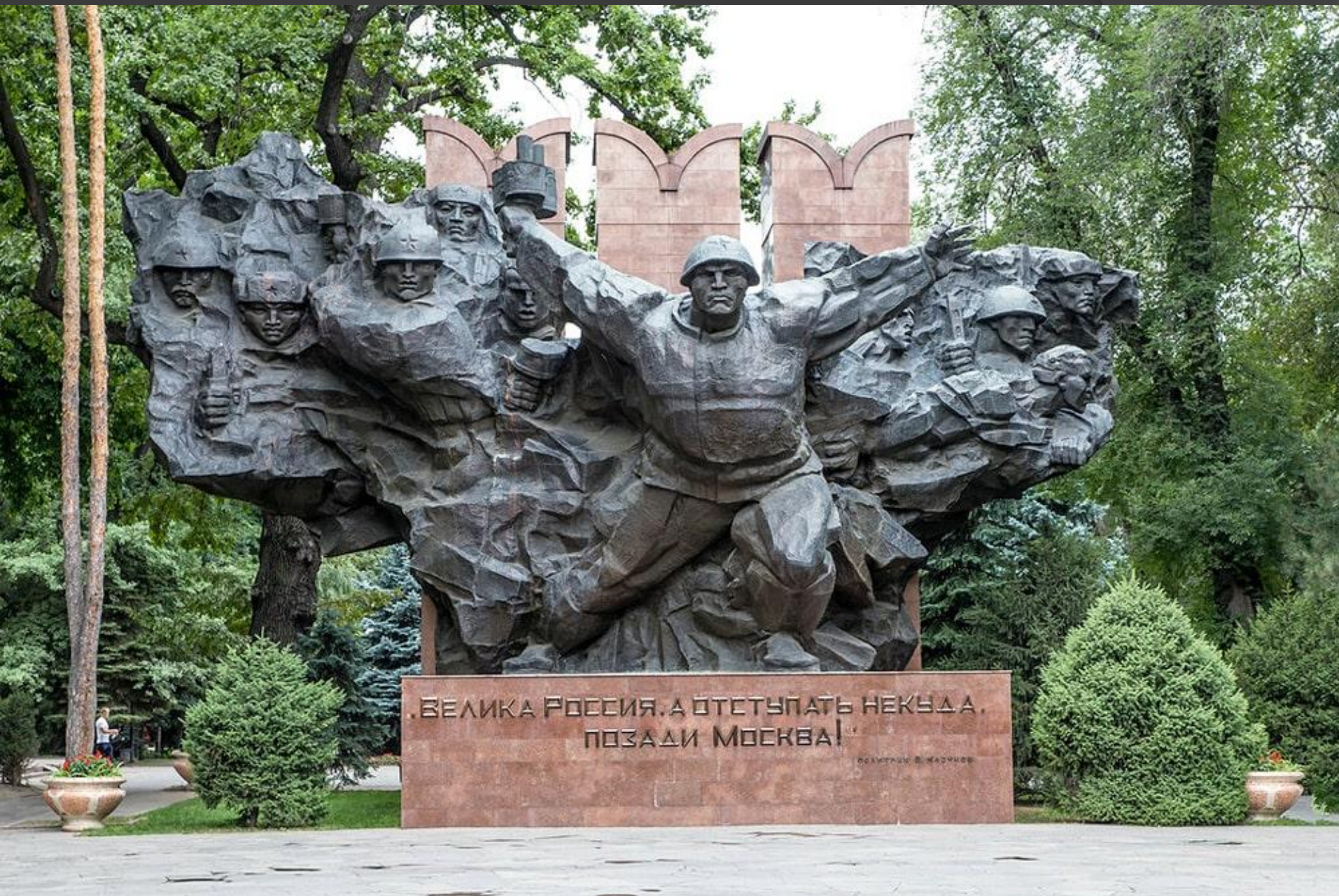
Памятник 28 панфиловцам, Алматы