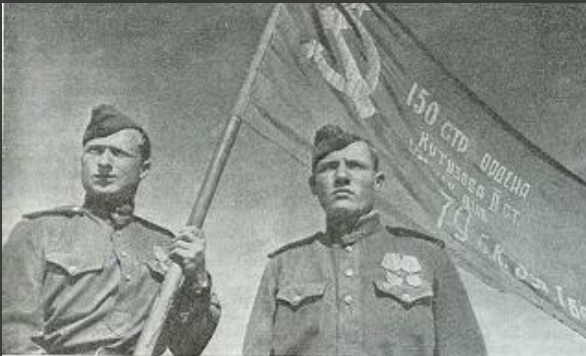
Разведчики 736-го полка 150-й стрелковой дивизии: М. А. Егоров (справа) и М. В. Кантария со Знаменем Победы, Берлин, Май 1945,

Мелитон Кантария (слева) и Михаил Егоров на фотографии 1945 года со Знаменем Победы