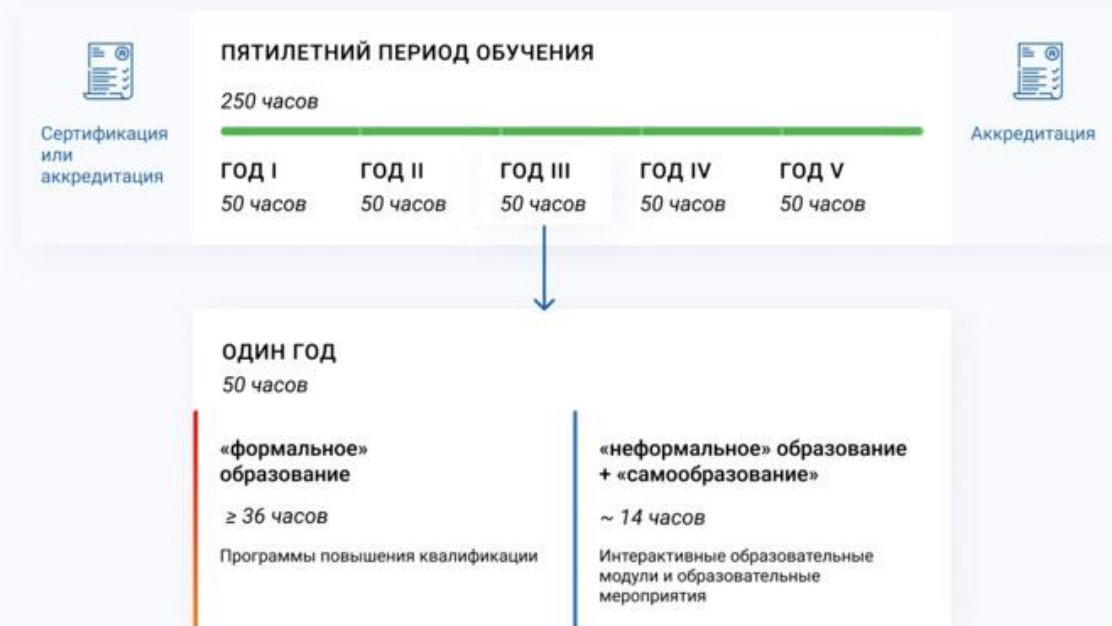
Схема 2. Рекомендации по объему, графику обучения и долевого распределению различных компонентов непрерывного образования