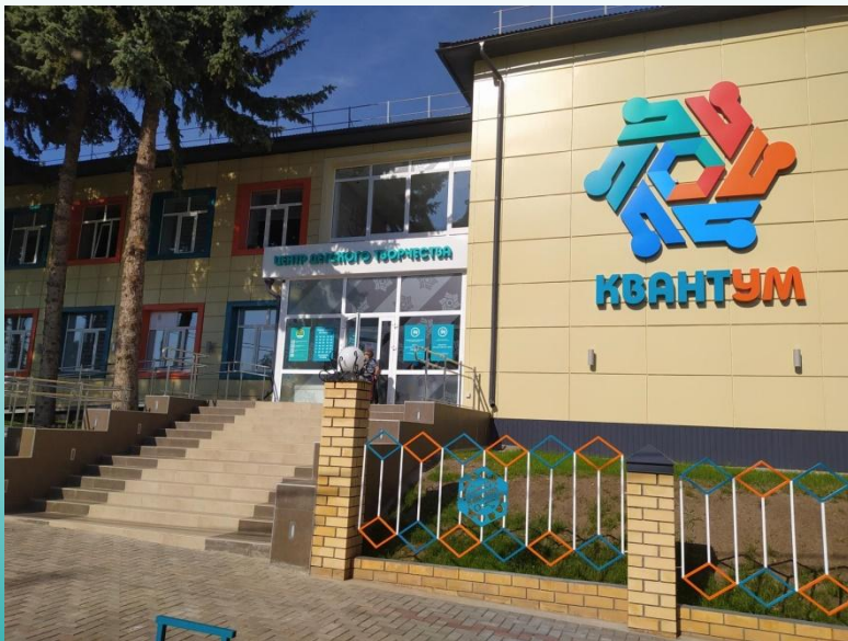
Центр детского творчества «Квантум»