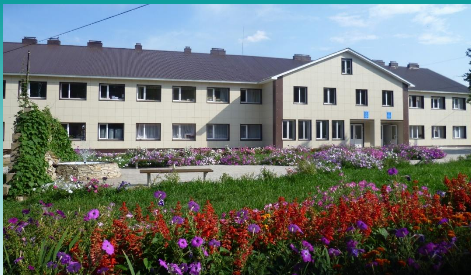
ГБОУ «Мамадышская школа-интернат»