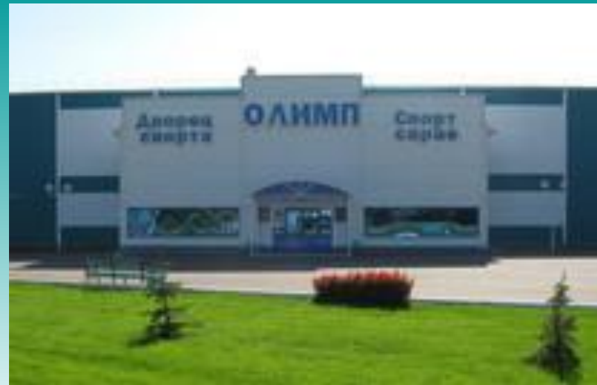
Ледовый дворец «Олимп»