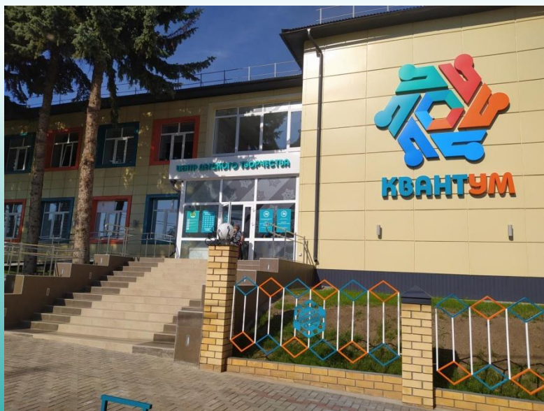
Центр детского творчества «Квантум»