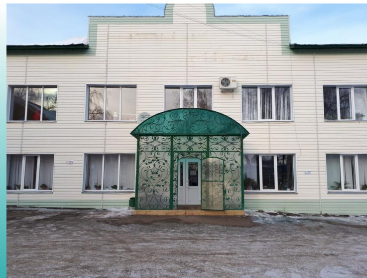
Подростковый клуб «Мечта»