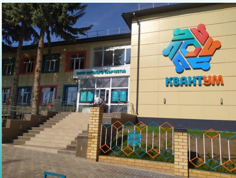
Центр детского творчества «Квантум»