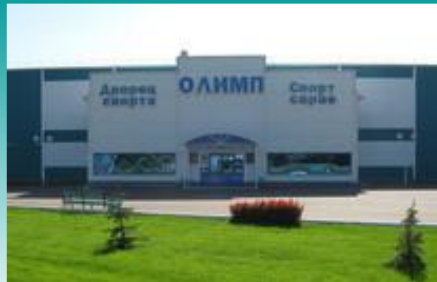
Ледовый дворец «Олимп»