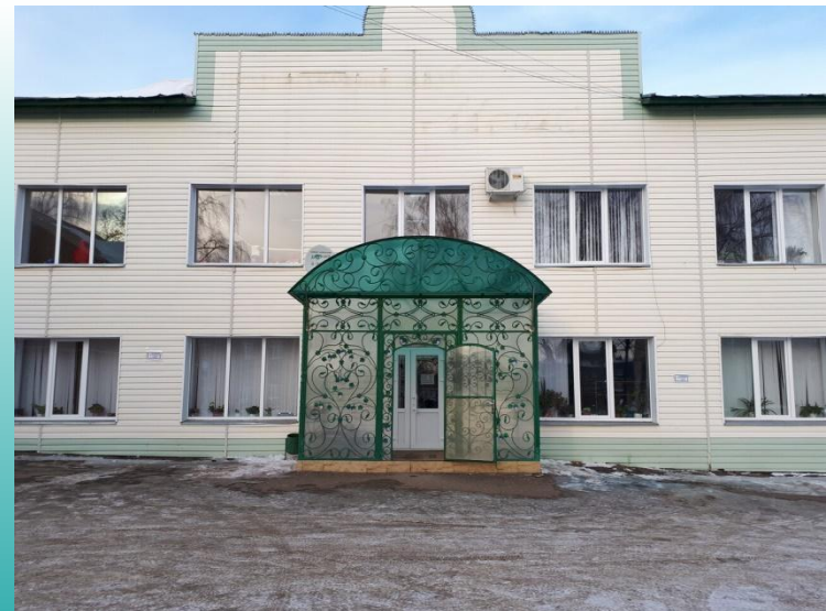
Подростковый клуб «Мечта»