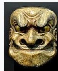
маска для демонических ролей обэсими