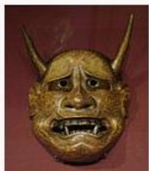
маска женского демона ревности ханья