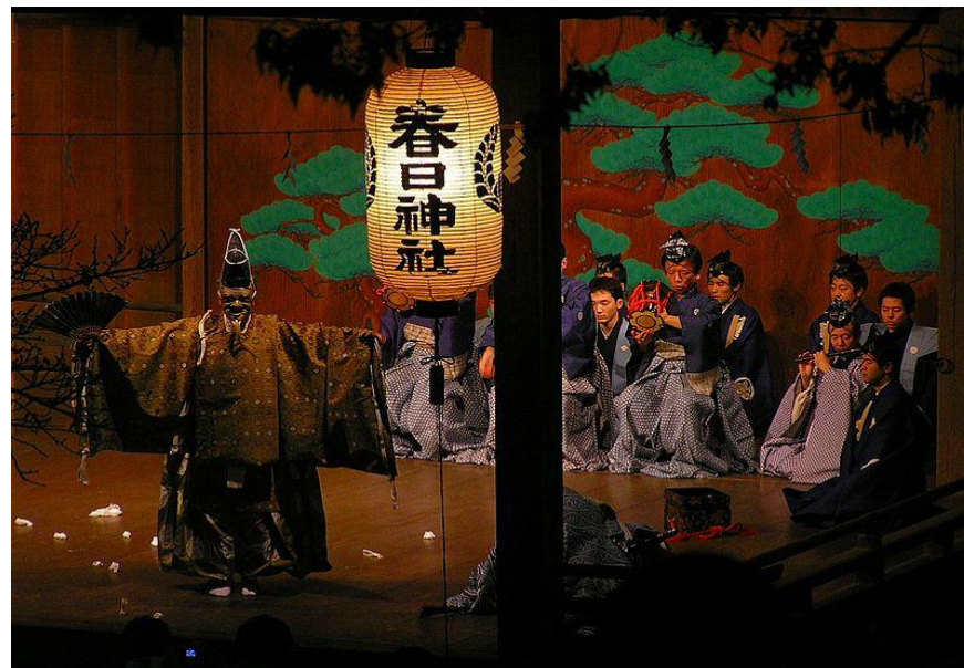
Некоторые из масок театра но: