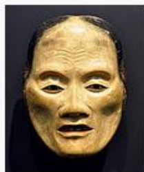
маска старухи рокзё