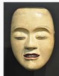
маска слепого юноши сэмимару