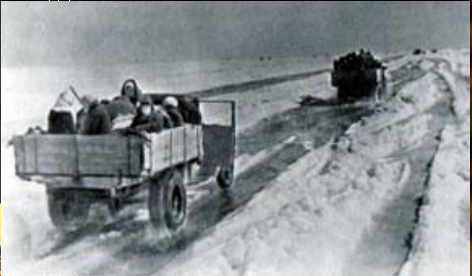
“Дорога жизни” через Ладожское озеро

Необходимость проложить новую дорогу к Ленинграду возникла после того, как замкнулось кольцо блокады вокруг города. Единственной возможностью было использовать для этих целей озеро Ладогу. После наступления холодов, прямо по льду, была проложена сложная транспортная магистраль, конфигурация которой менялась в зависимости от условий. Люди прозвали её Дорогой жизни.