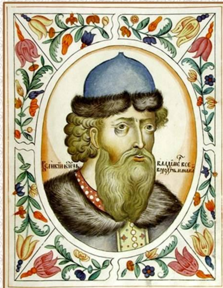
Великий князь Владимир Всеволодович Мономах. Портрет из Царского титулярника. 1672 год

В случае опасности объединимся чистосердечно и будем хранить Русскую землю от опасности»