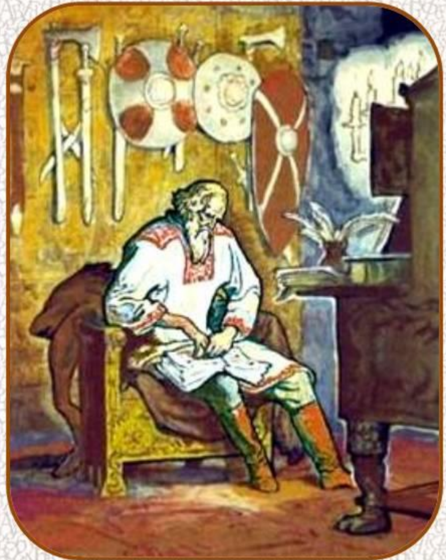
Великий князь Владимир Мономах. И. Архипов

«Молод был и состарился, и не видел праведника покиннутым, ни потомков его просвещенных»