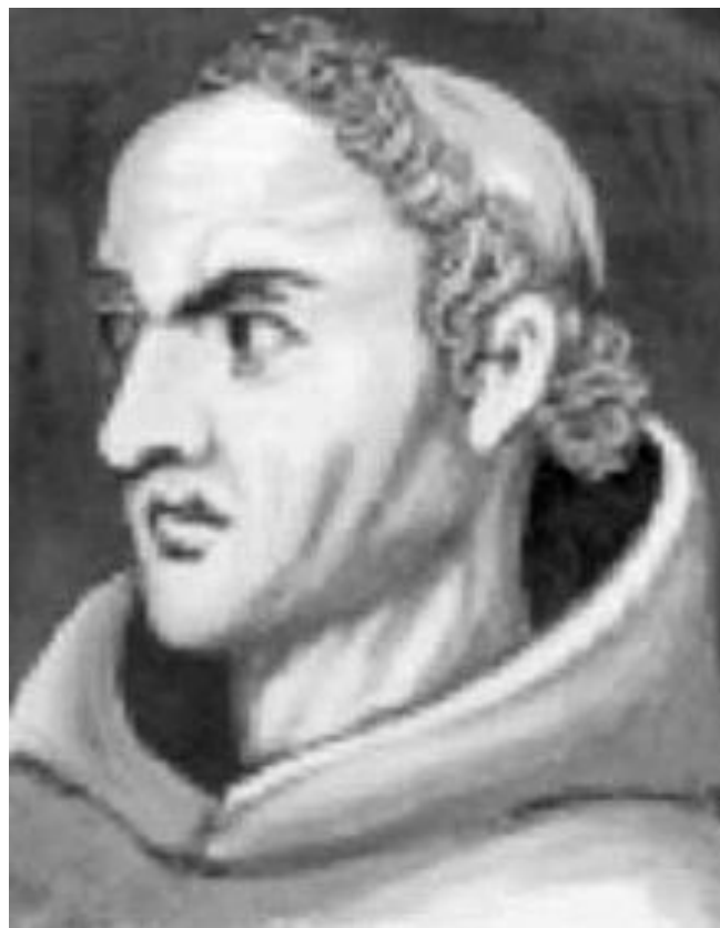
Уильям Оккам (1285-1349)