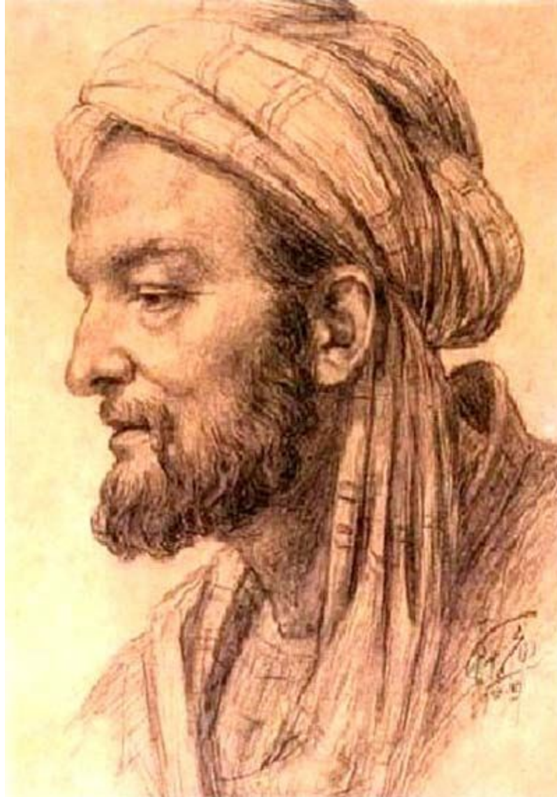
Ибн аль-Хайсам (Альгазен) (965-1039)