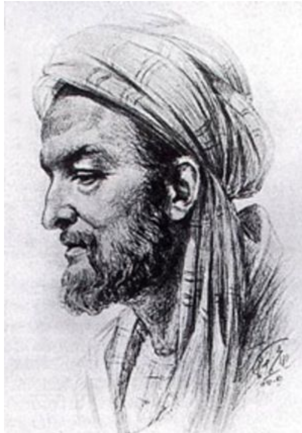
Ибн Сина (980-1037)