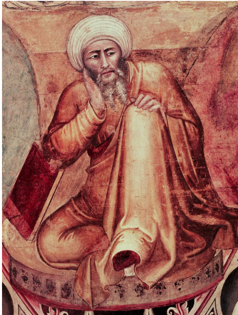
Ибн Рушд (1126-1198)