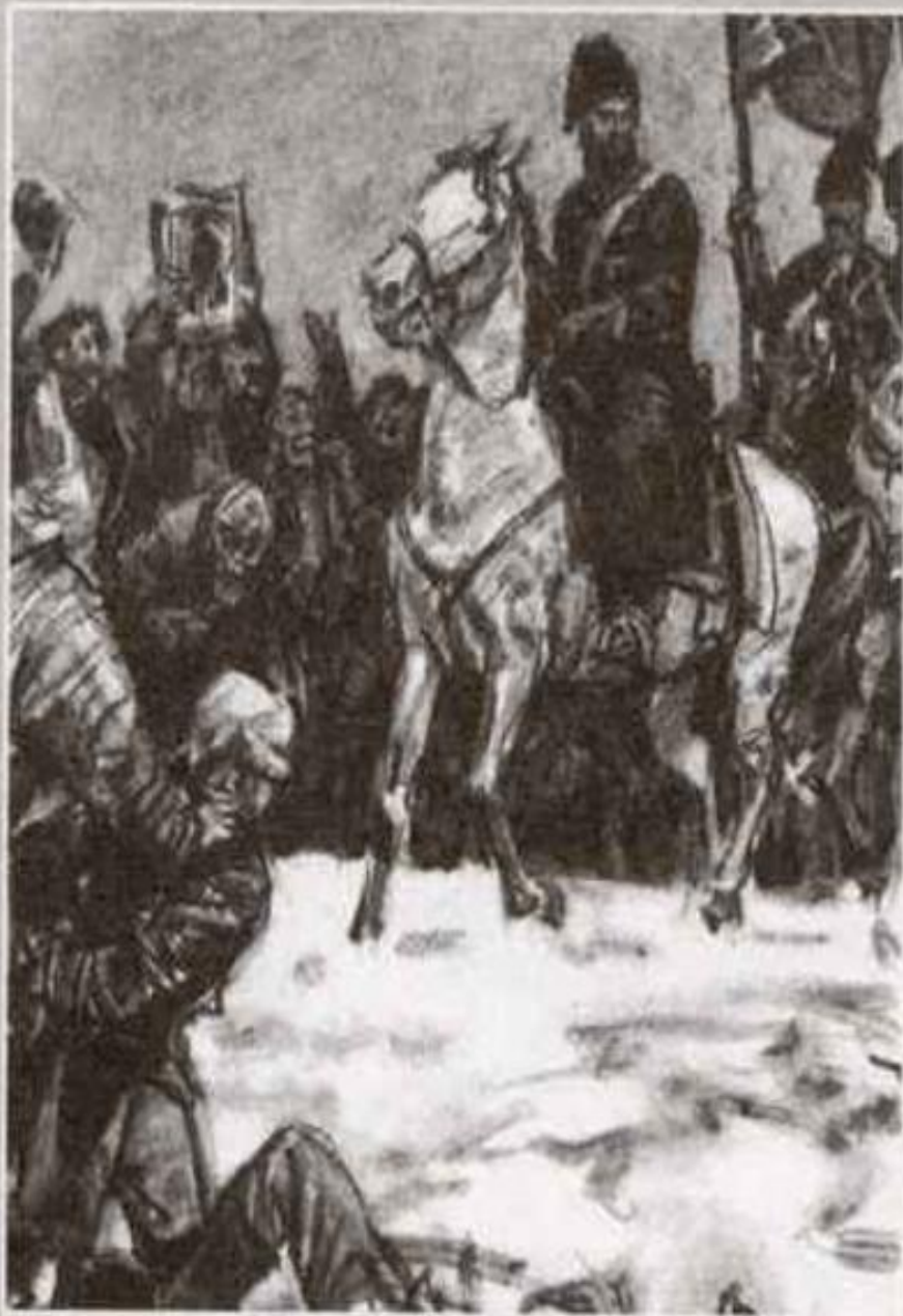
На коне Пугачёв

В 1773 году возглавил восстание крестьян на Яике, провозгласив себя чудом спасшимся императором Петром III.