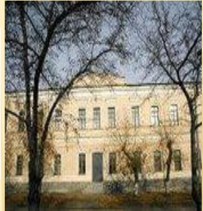
Троицк педагогия техникумы

“Ана телендә сабак укып үскән бала телен онытмый, милләтен югалтмый, Ватанын алыштырмый”.