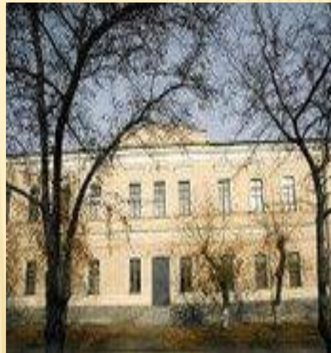
Троицк педагогика техникумы

“Ана телендә сабак укып үскән бала телен онытмый, милләтен югалтмый, Ватанын алыштырмый”.