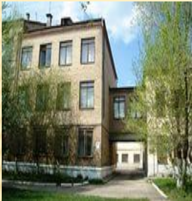
Магнитогорск шәһәренең 35 санлы татар мәктәбе