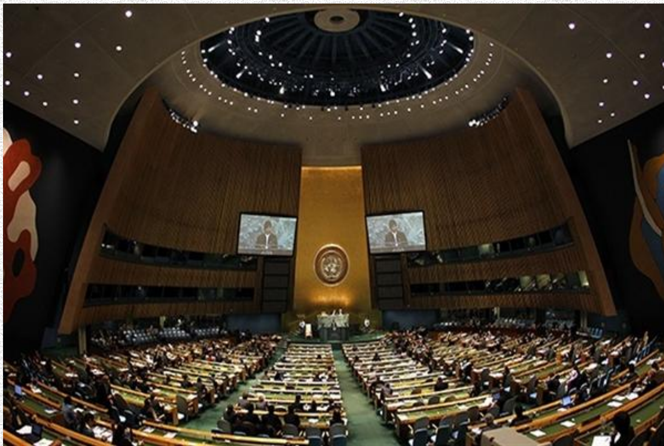
Зал заседания Генеральной Ассамблеи ООН

Генеральная Ассамблея является главным совещательным, директивным и представительным органом ООН, который состоит из представителей всех государств-членов (193 государства).