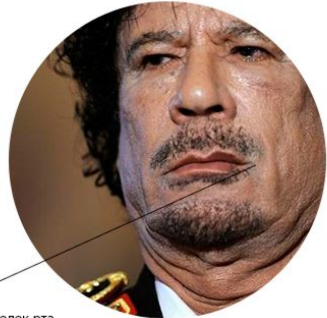
Приподнятый уголок рта с одной стороны