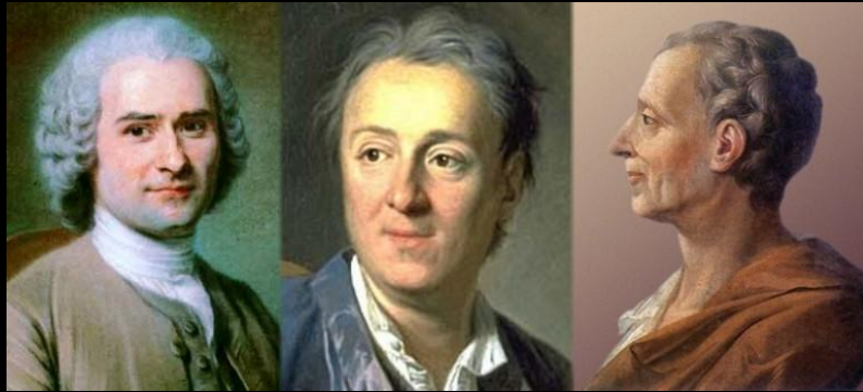
Ж.-Ж. Руссо, Д. Дидро и Ш. Монтескьё