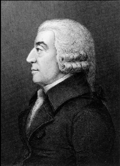
Шотландский экономист А. Смит