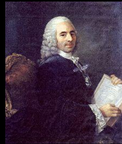
Физиократы А. Р. Тюрго и Ф. Кенэ