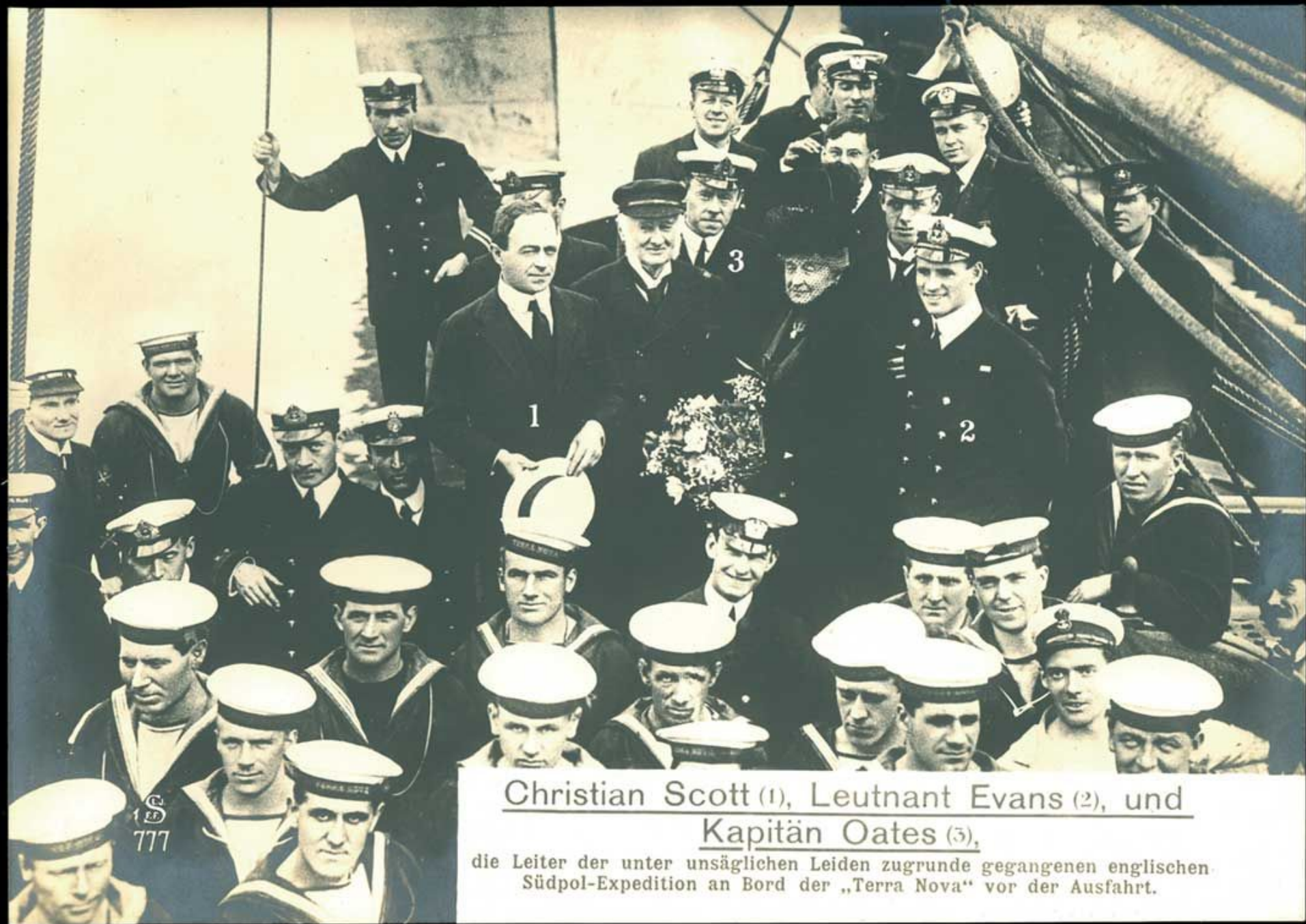
Christian Scott (1), Lieutenant Evans (2), und Kapitän Oates (3),

die Leiter der unter unsäglichen Leiden zugrunde gegangenen englischen Südpol-Expedition an Bord der „Terra Nova“ vor der Ausfahrt.