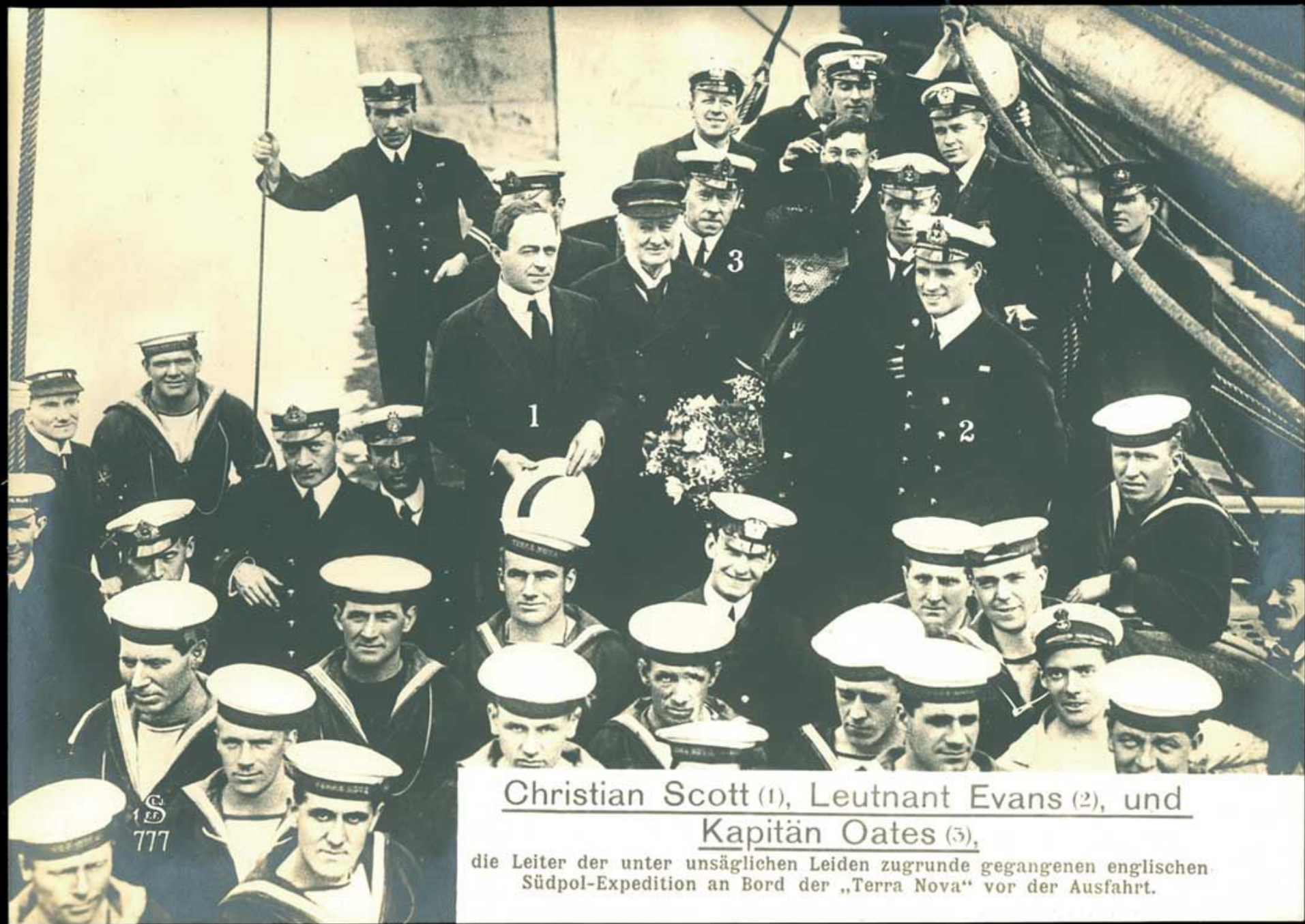
Christian Scott (1), Leutnant Evans (2), und Kapitän Oates (3),

die Leiter der unter unsäglichen Leiden zugrunde gegangenen englischen Südpol-Expedition an Bord der „Terra Nova“ vor der Ausfahrt.