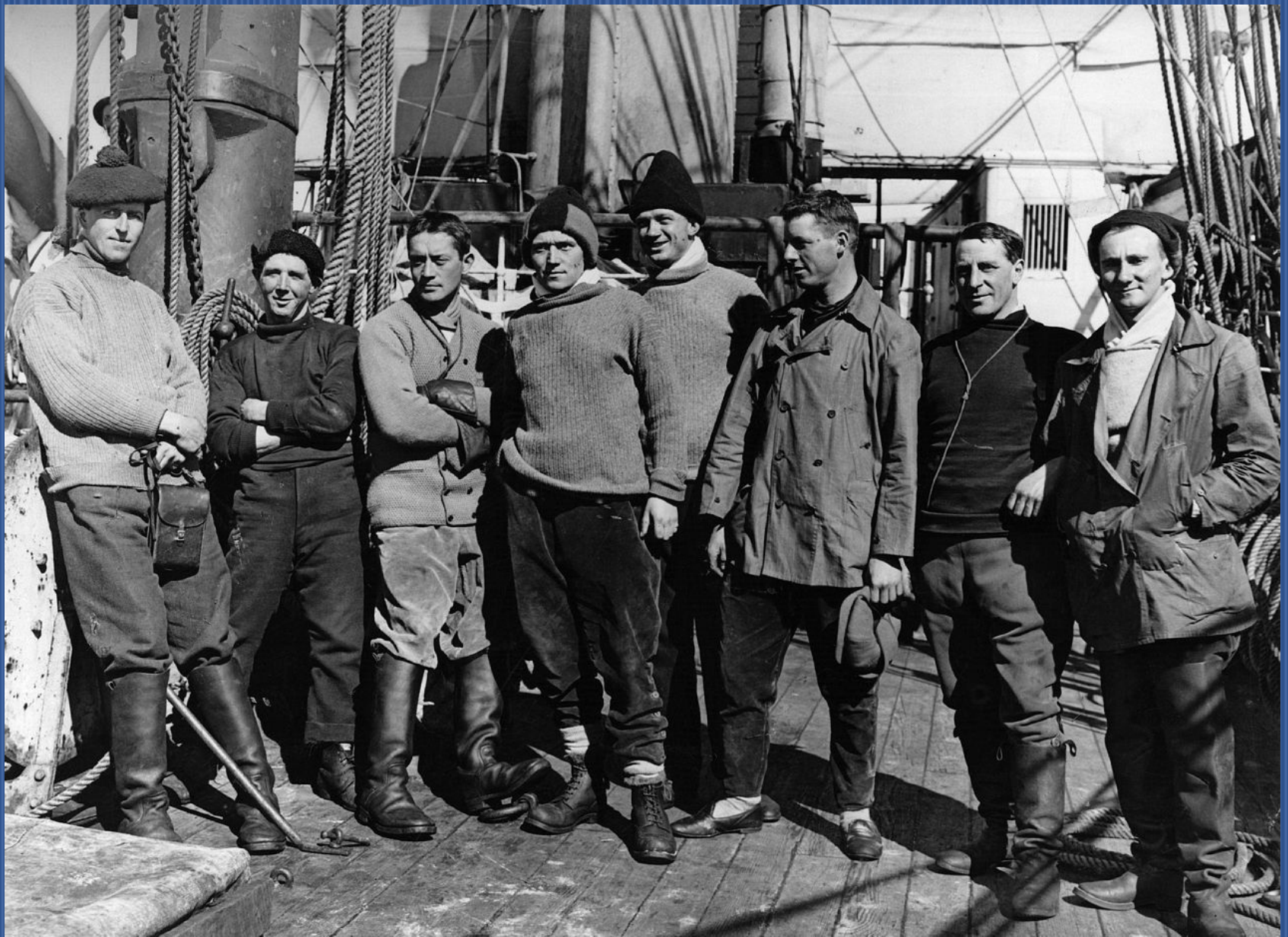
Офицеры «Терра Нова» и Роберт Скотт