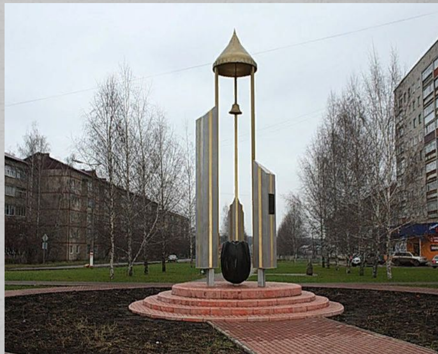
Местоположение: бульвар Горшкова.