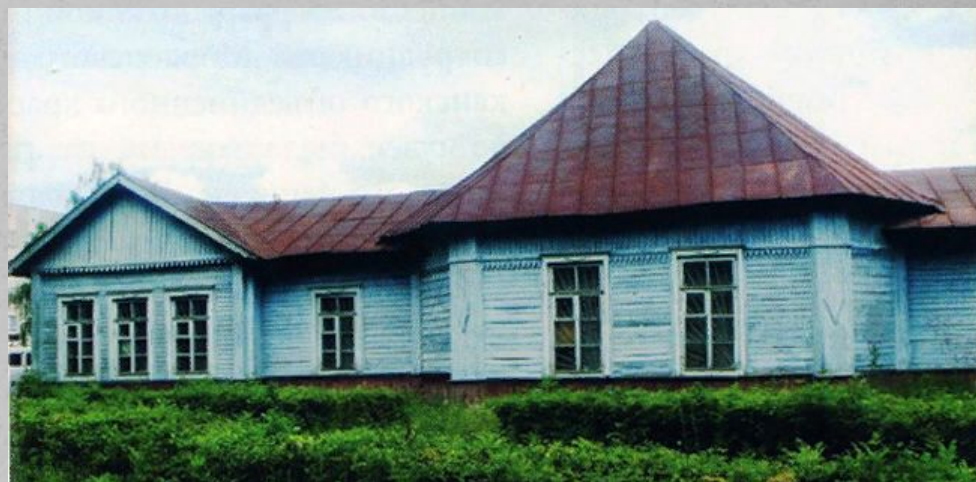
Местоположение: улица Куйбышева — 60.