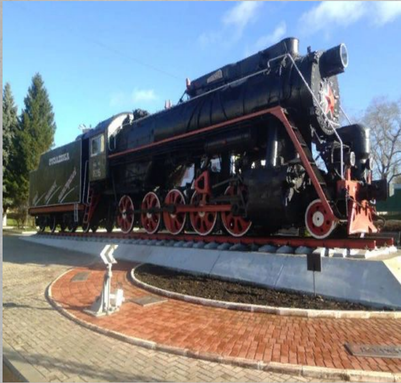
Местоположение: Привокзальная площадь — 5.

«Лебедянка», начал свою работу в год окончания Великой Отечественной войны, послужив основным транспортом в строительстве-восстановлении. На тот момент он по праву считался одним из самых быстрых и достигал скорости почти в сто километров в час. Таких же локомотивов выпущено было около четырех тысяч, и изначально они назывались просто по первой букве – Л. Уже в народе паровоз получил свое имя Лебедянка.