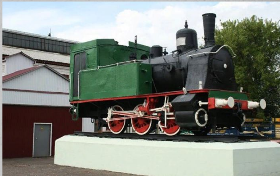
Местоположение: ул. Революции 1905 года, 7