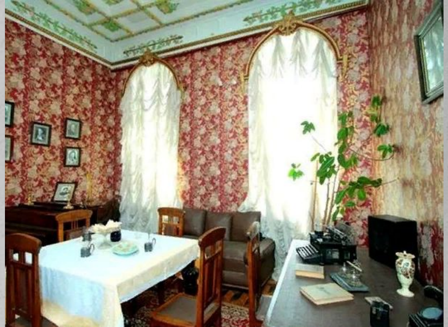
Местоположение: Рузаевский р-н, с. Татарская Пишля, Школьный пер., д.5