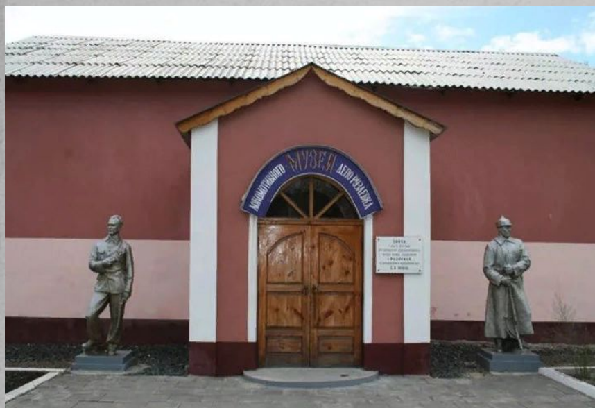
Местоположение: улица Революции 1905 г. — 7