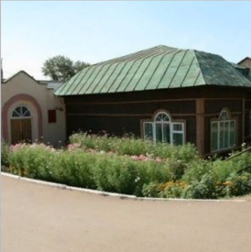
Местоположение: улица Ленина — 48.