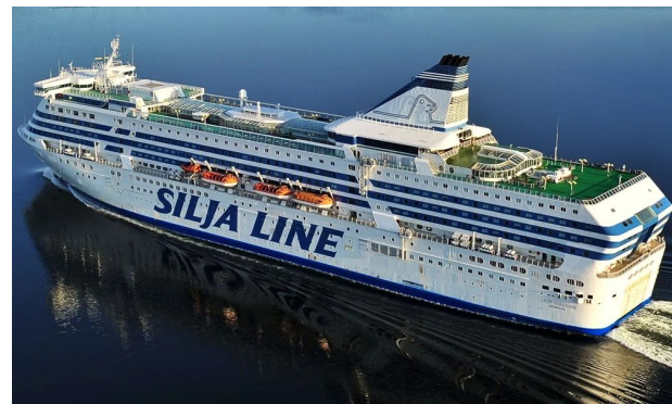
паром "Silja Line"