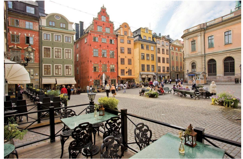
г. Гамла Стан.

Завтрак на пароме для желающих (доп.плата). В 06.30 прибытие в Капельшер. Переезд в г. Стокгольм (90 км). Обзорная автобусно-пешеходная экскурсия по городу. Присутствие на церемонии Смены Гвардейского Караула. Прогулка по Старому городу Гамла Стан. Свободное время для посещения музеев «ВАСА» (вх.билеты 70/10 крон). «СКАНСЕН» (вх.билеты 60/20 крон) или «ЮНИБАКЕН» (вх. билсты 85/65 крон). Отправление в 20:15 из Стокгольма на пароме 5 /а [4те. Для желающих ужин (шведский стол) на пароме за доп. плату.