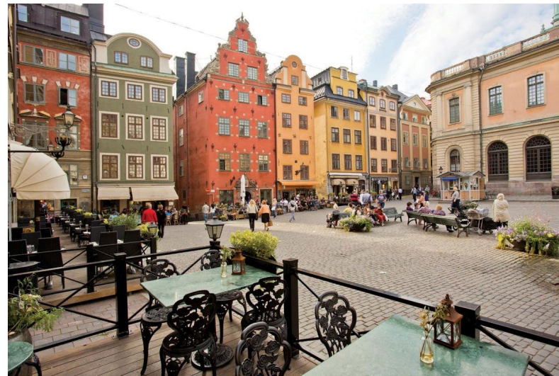
г. Гамла Стан.

Завтрак на пароме для желающих (доп.плата). В 06.30 прибытие в Капельшер. Переезд в г. Стокгольм (90 км). Обзорная автобусно-пешеходная экскурсия по городу. Присутствие на церемонии Смены Гвардейского Караула. Прогулка по Старому городу Гамла Стан. Свободное время для посещения музеев «ВАСА» (вх.билеты 70/10 крон). «СКАНСЕН» (вх.билеты 60/20 крон) или «ЮНИБАКЕН» (вх. билсты 85/65 крон). Отправление в 20:15 из Стокгольма на пароме 5 /а [4те. Для желающих ужин (шведский стол) на пароме за доп. плату.